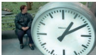
A unha e dez.