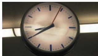
As nove menos vinte.