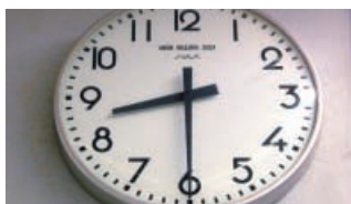
As oito e media.