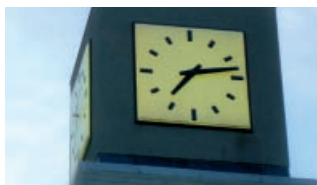
As sete e cuarto.