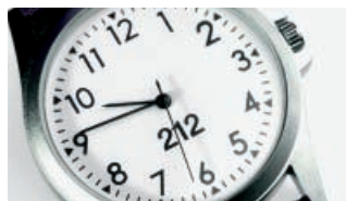
As dez menos cuarto.