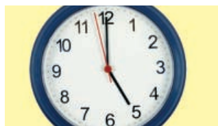
As cinco en punto.

B. Maruxa traballa nunha axencia de viaxes en Ferrol. A que hora cres que fai todas estas actividades? Relaciona as actividades coas horas. Logo, compara as túas respostas coas dos teus compañeiros.