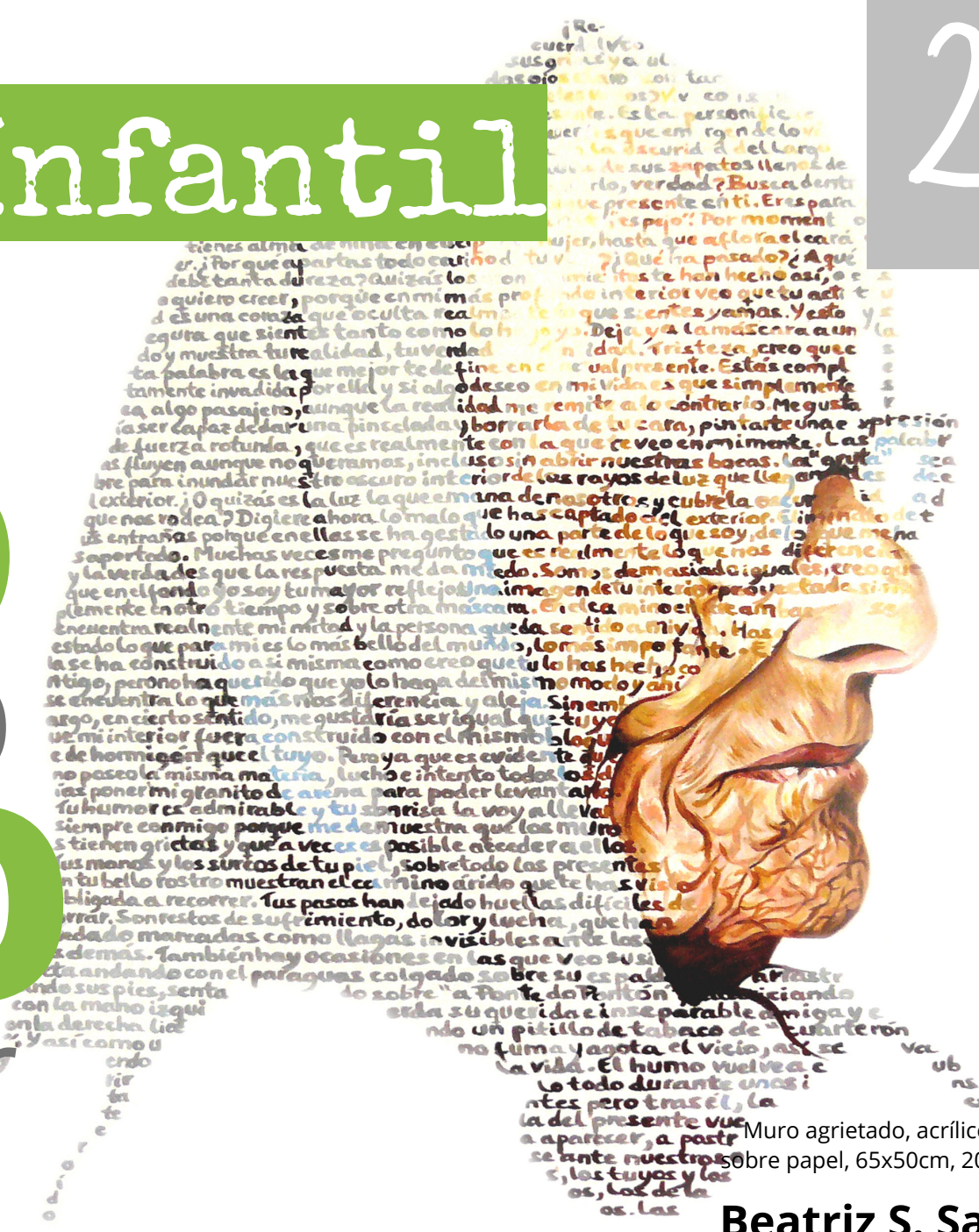
Muro agrietado, acrílico sobre papel, 65x50cm, 2010