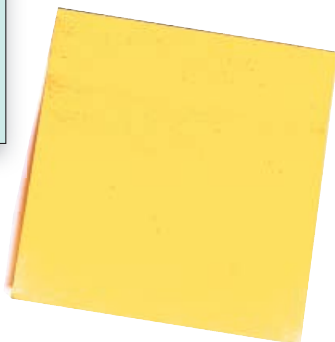
Escribir unha nota