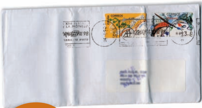
Mandar unha carta