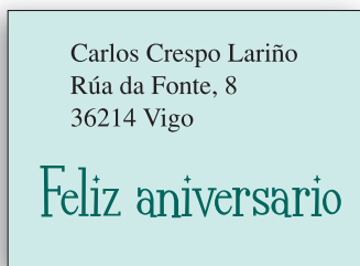
Enviar unha tarxeta