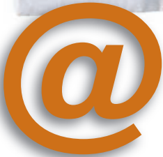
Escribir unha mensaxe electrónica