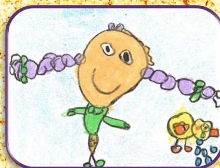
Lucía Domínguez de la Fuente