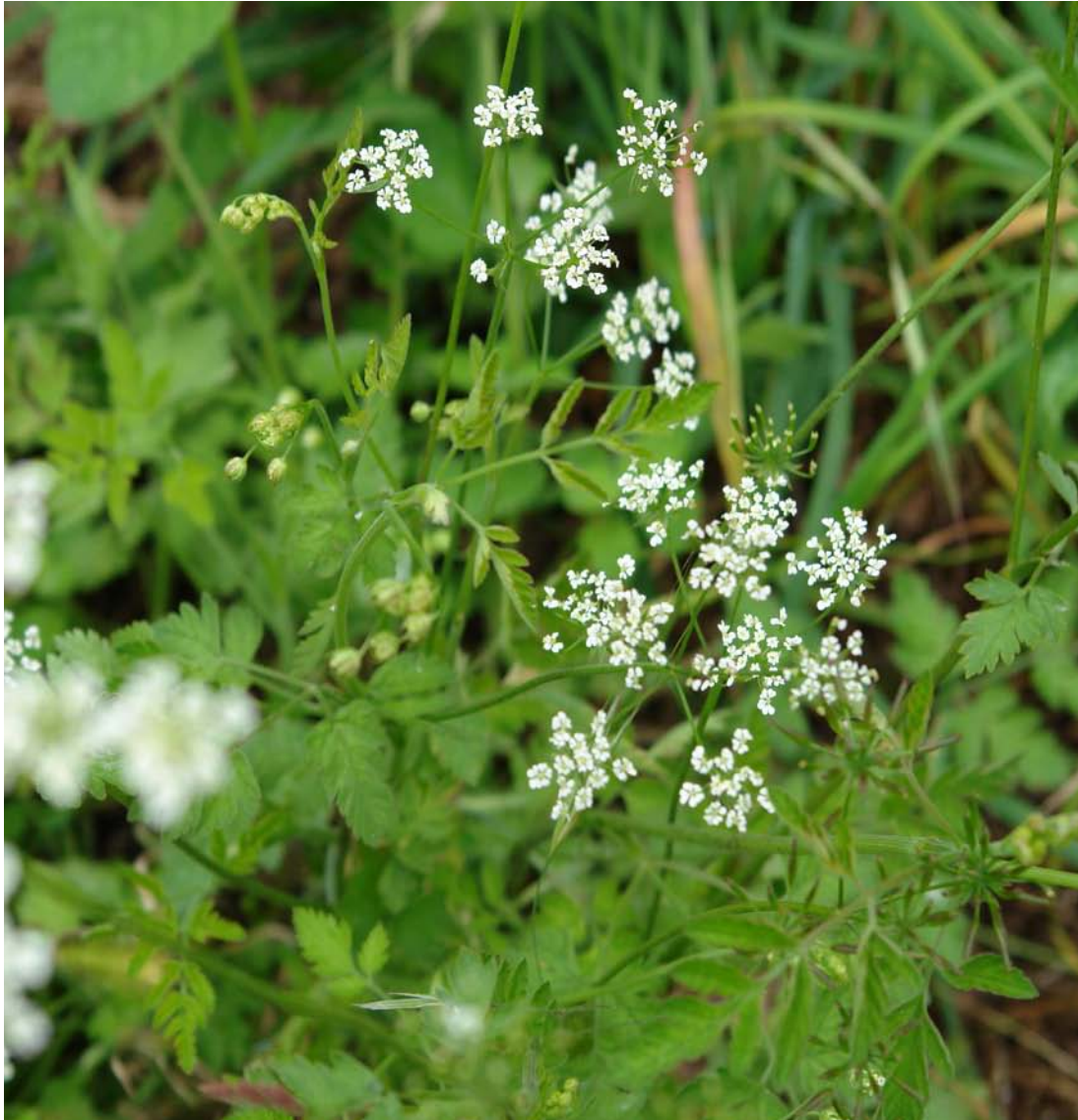
G.: PERIFOLLO C.: perifollo borde N.C.: Anthriscus sylvestris