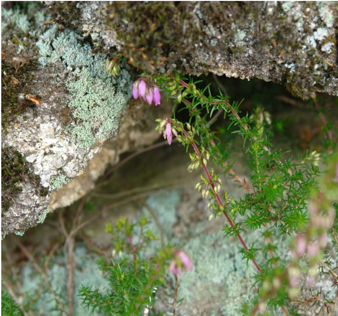
G: CARPAZA, QUEIROA C.: brezo nazareno, carpaza N.C.: Erica cinerea