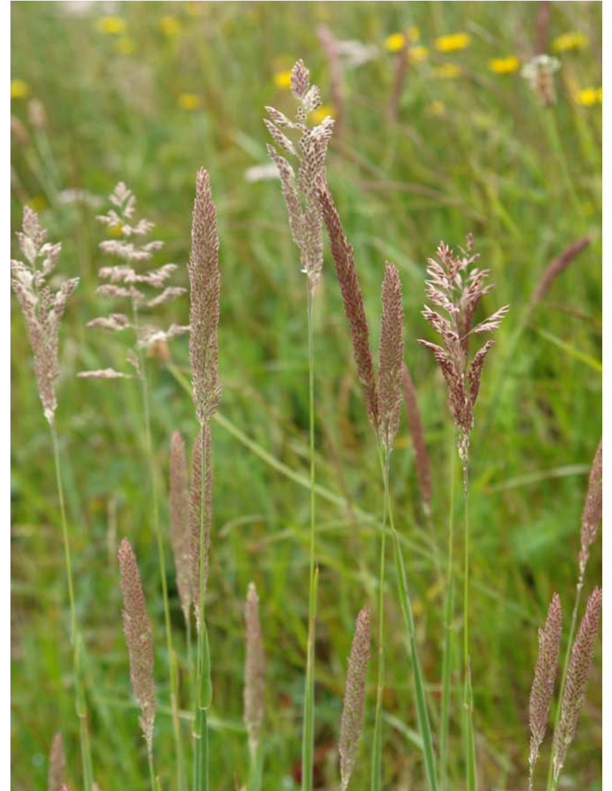
G: HERBA TRIGA C.: heno blanco N.C.: Holcus lanatus