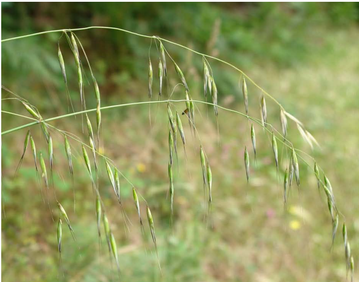
G.: AVEA BRAVA C.: avena bordo N.C. Avena barbata