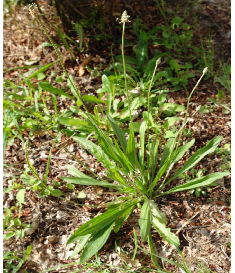
G.: LINGUA DE OVELLA, CORREOLA C.: llantén menor N.C.: Plantago lanceolata