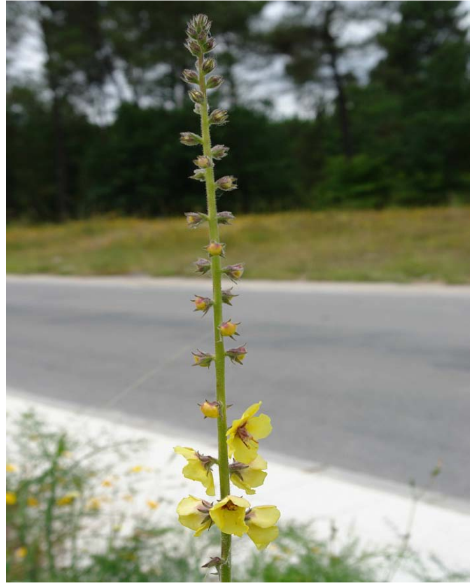
G: GORDOLOBO C: gordolobo N.C.: Verbascum sp.