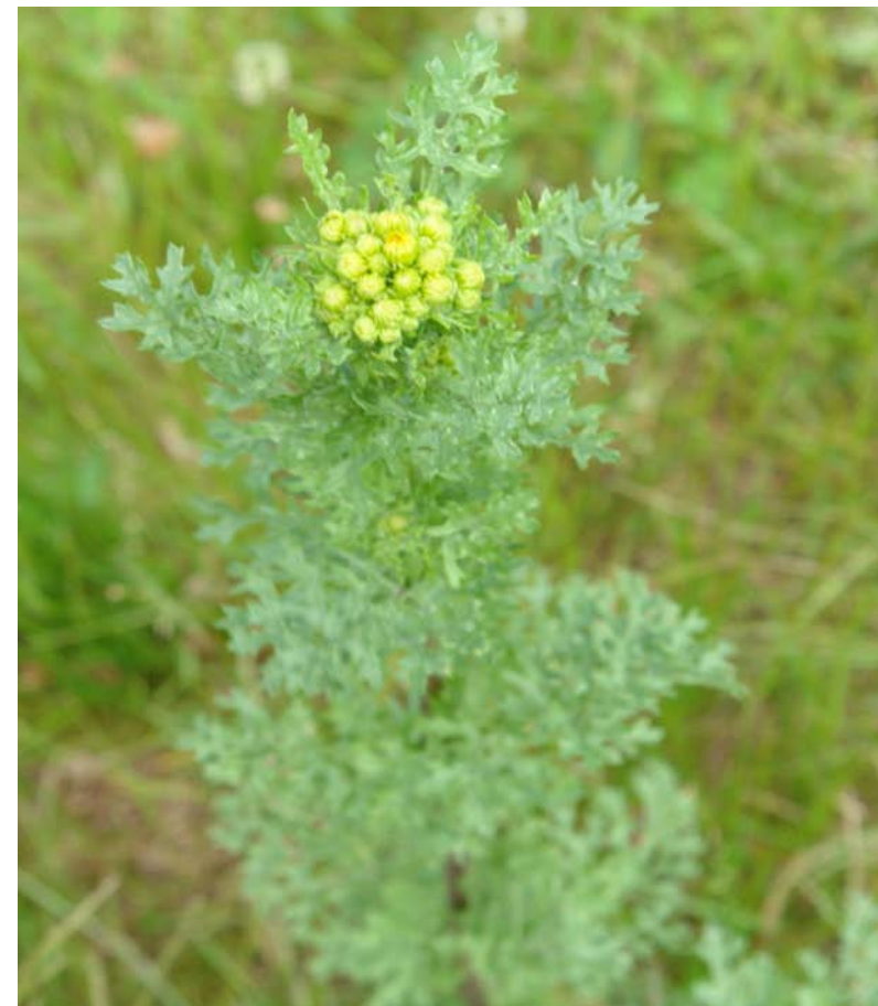
G.: HERBA DE SANTIAGO C.: hierba de santiago, azuzón N.C.: Senecio jacobaea