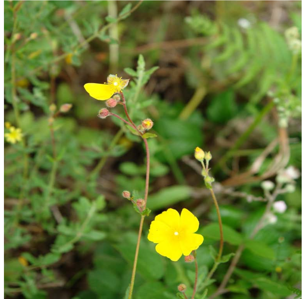
G: PERDIGUERA C: mirasol, jarilla del monte N.C. Helianthemum ovatum