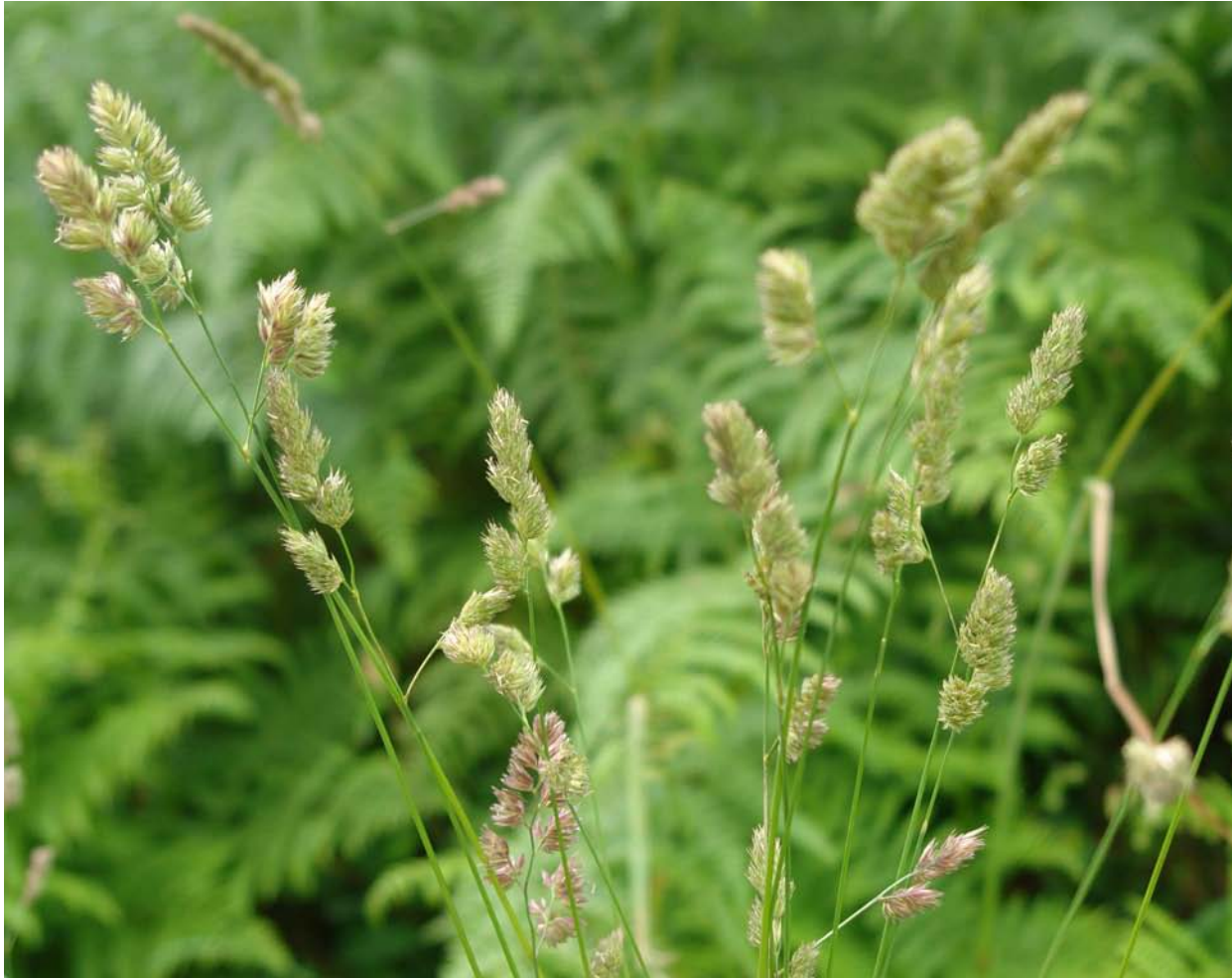
G.: CARACOLILLOS C.: dactilo, jopillos de monte N.C.: Dactylis glomerata