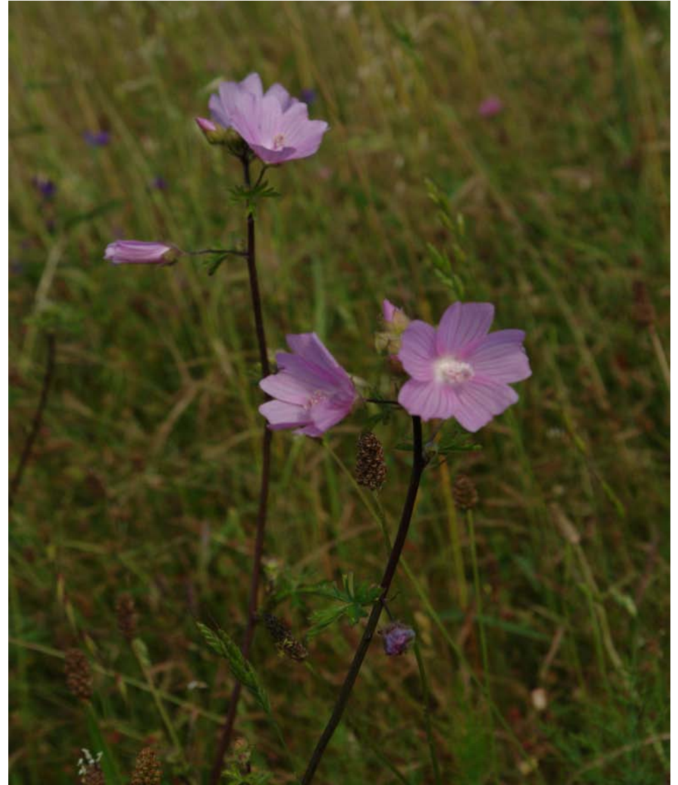
G.: MALVA C.: malva N.C.: Malva tournefortiana