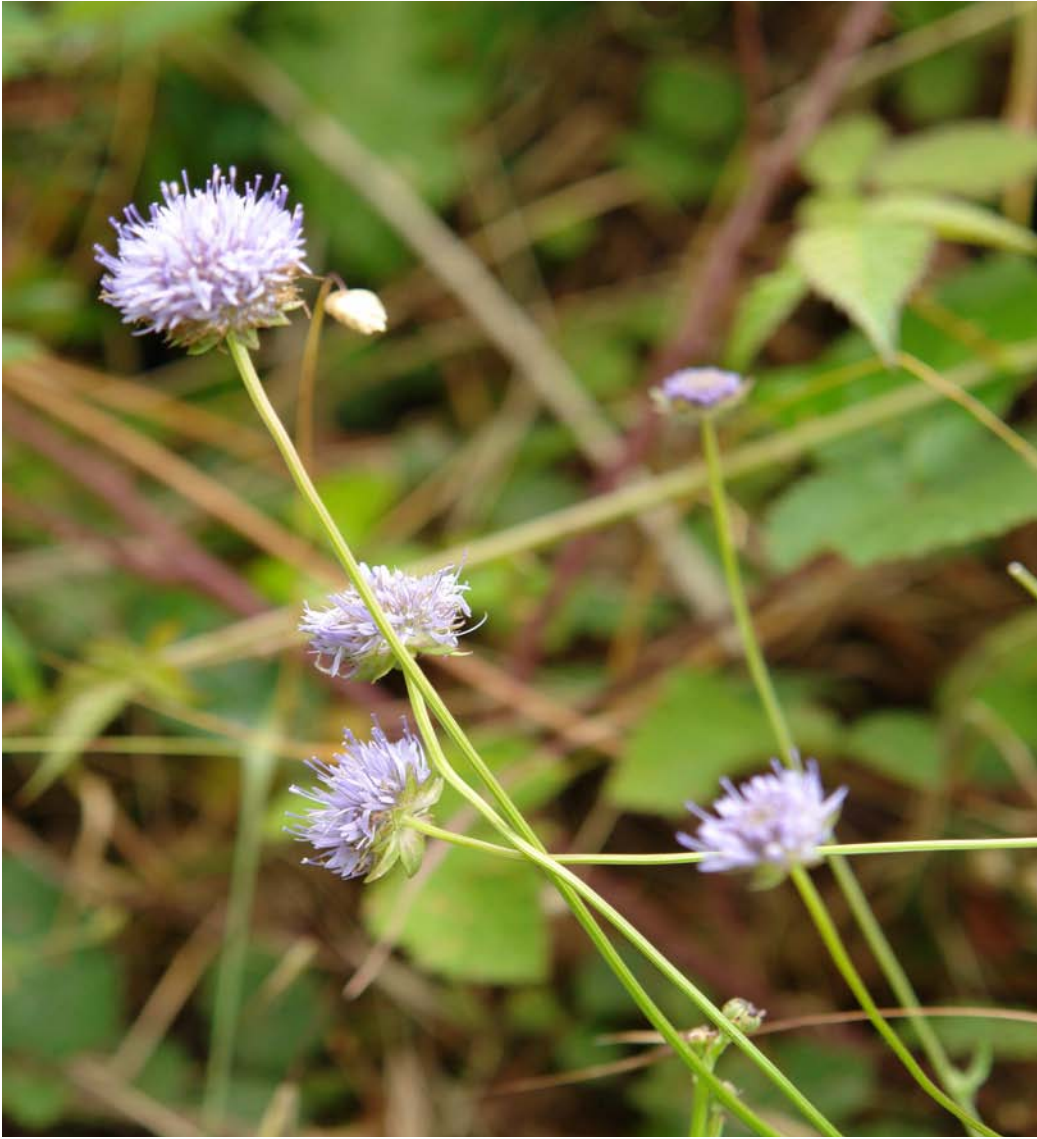
G: BOTÓN AZUL C: botón azul N.C.: Jasione montana