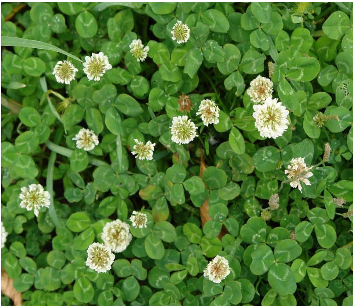
G.: TREVO BRANCO C.: trébol blanco N.C.: Trifolium repens