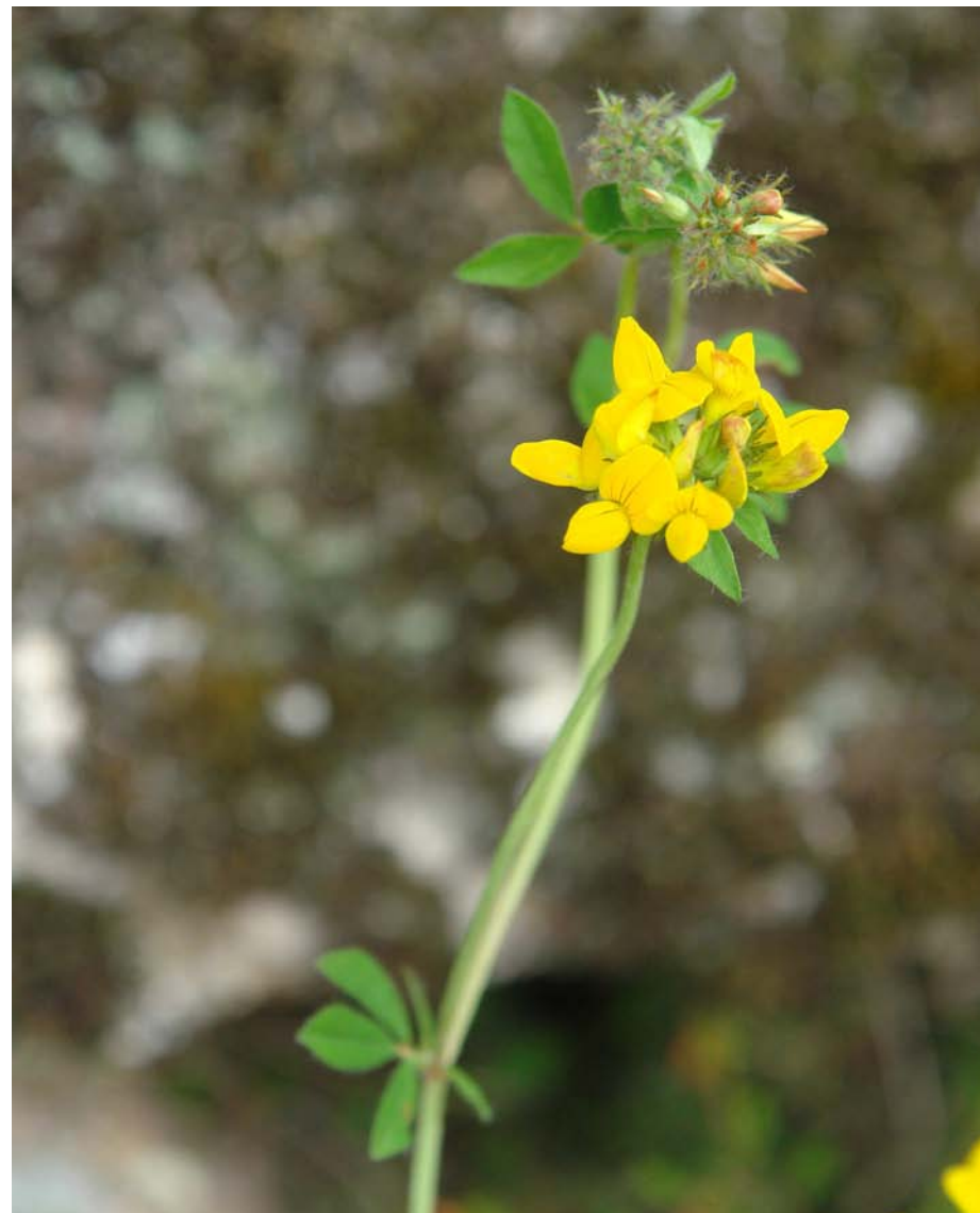
G: PÉ DE GALO C: cuernecillo, loto de los prados N.C.: Lotus corniculatus