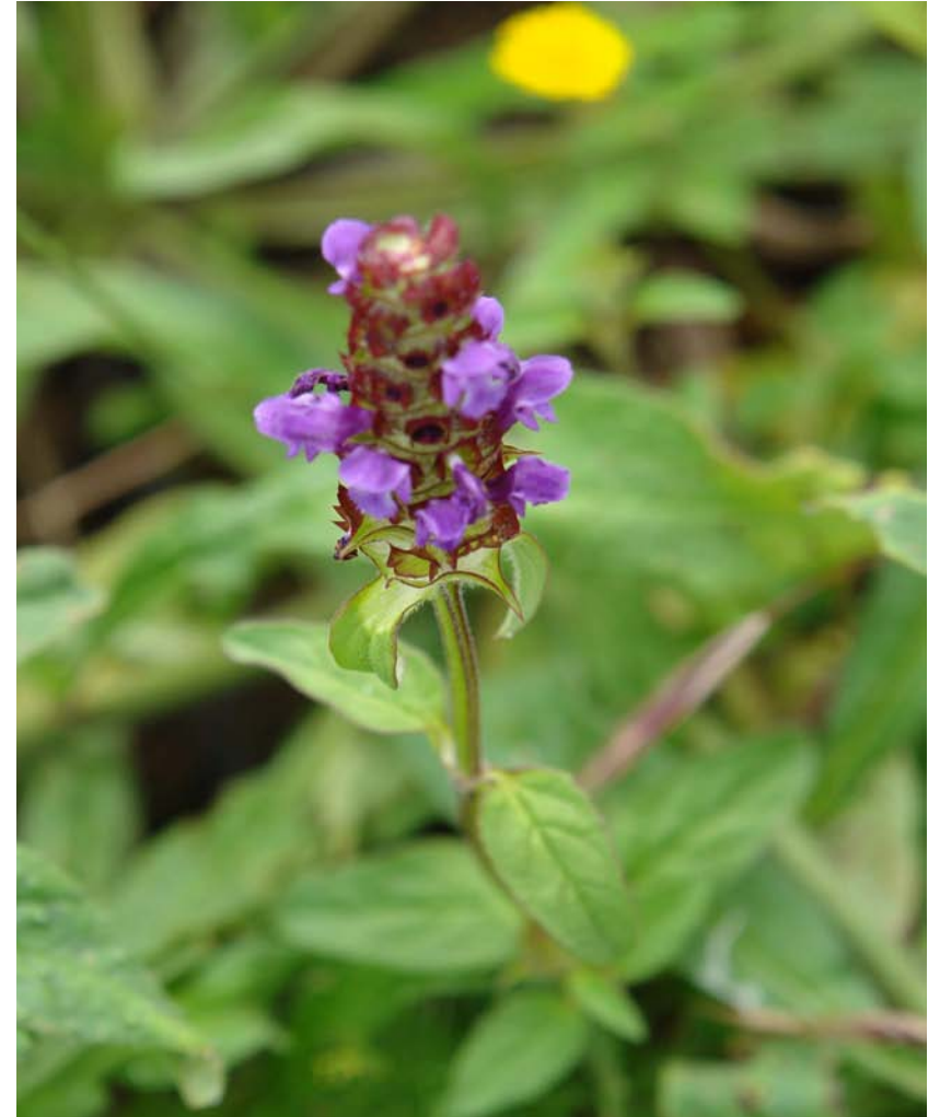
G.: HERBA DAS FERIDAS C.: brunela, hierba de las heridas N.C.: Prunella vulgaris