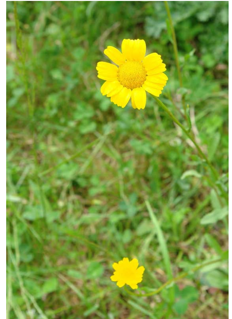
G. PAMPILLO, OLLO DE BOI C.: giralda N.C.: Chrysanthemum myconis