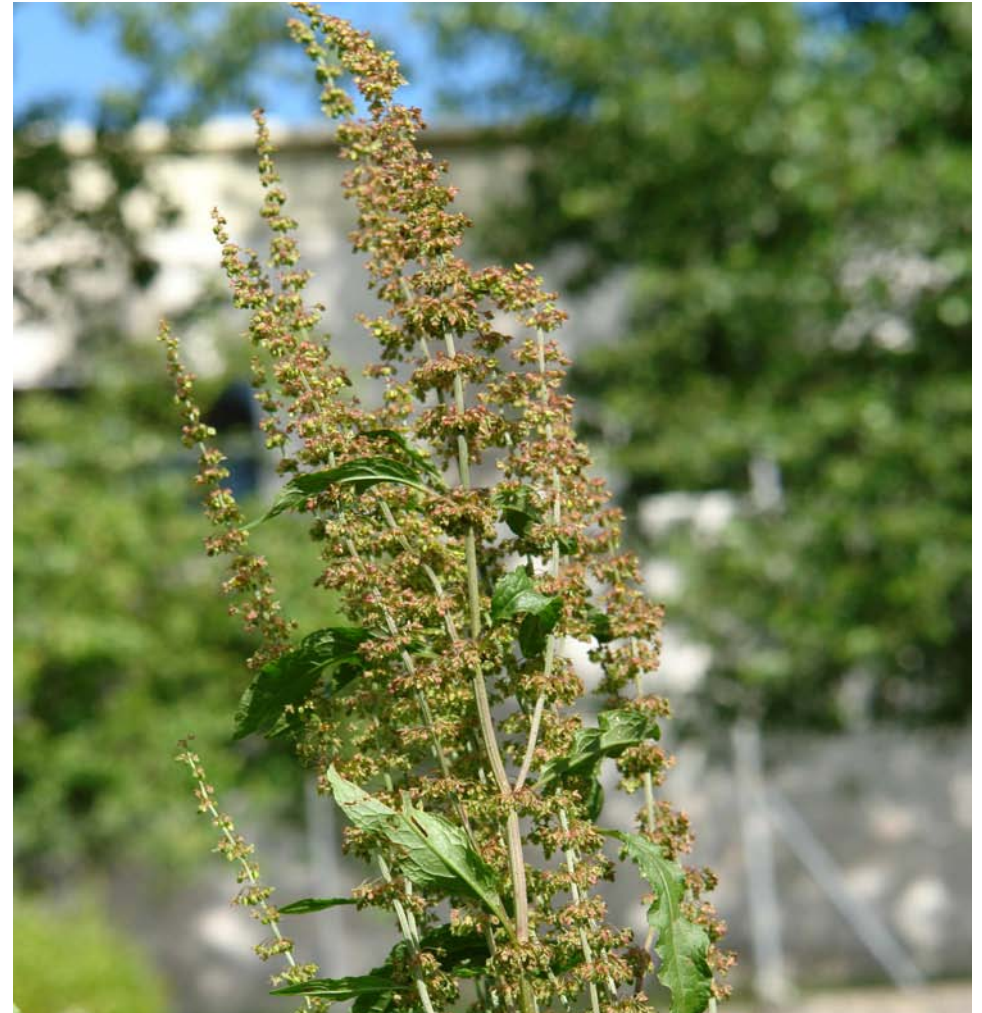
G.: ROMAZA DE FOLLA GRANDE C.: romaza grande N.C.: Rumex hydrolapatum