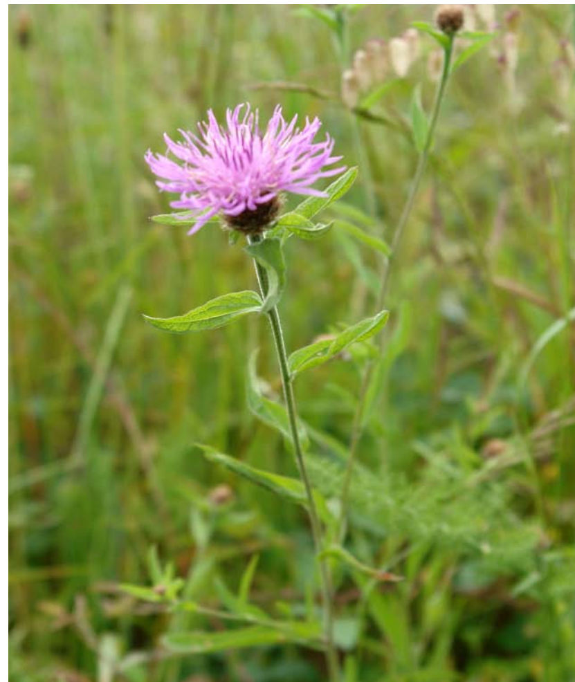
G.: CENTAURA C.: centaurea negra N.C.: Centaurea nigra