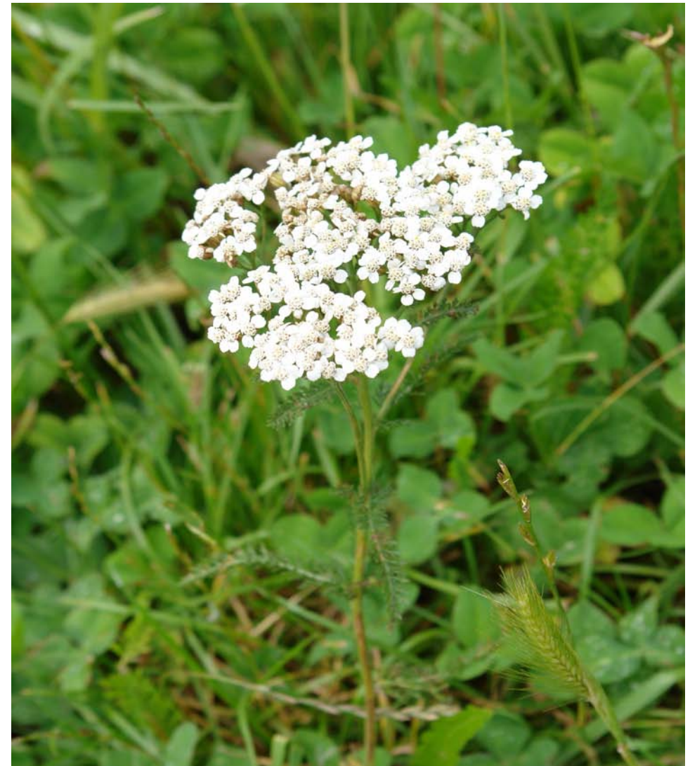
G.: HERBA DOS CARPINTEIROS; HERBA DA RULA C.: milenrama, aquilea N.C.: Achillea millefolium