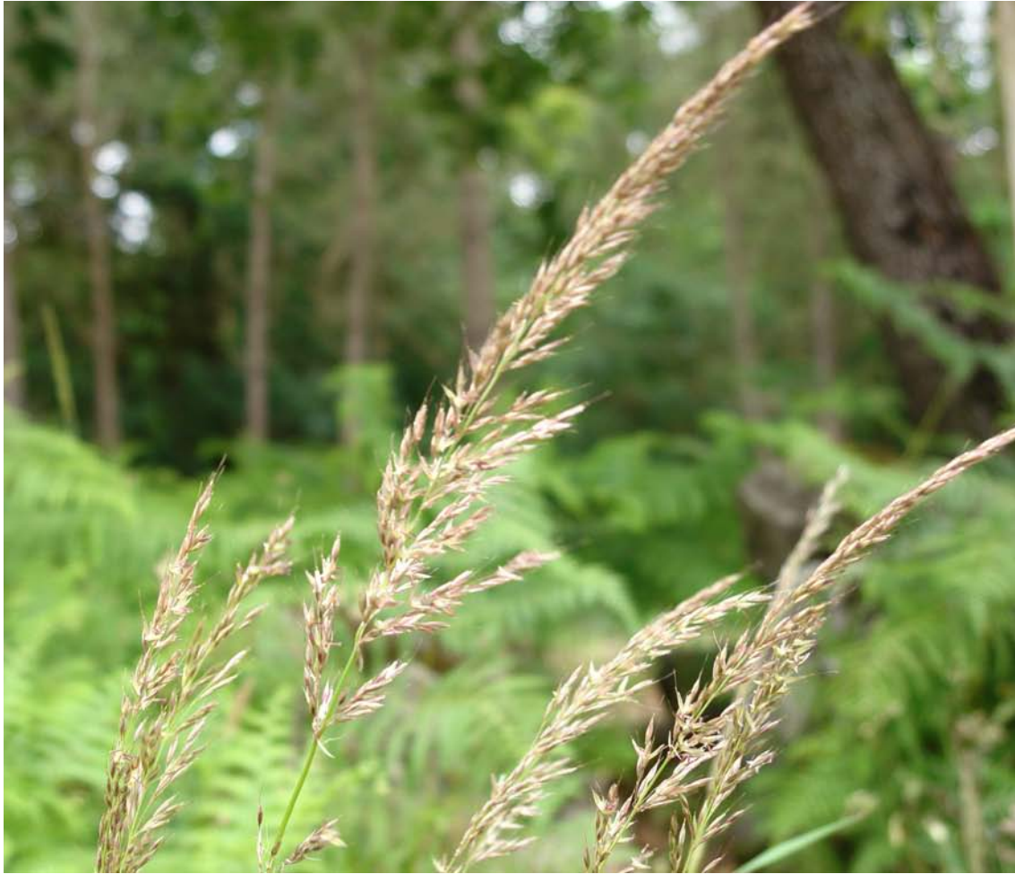
G.: CALAMAGOSTRIS C.: calamagostris N.C.: Calamagostris epigeios