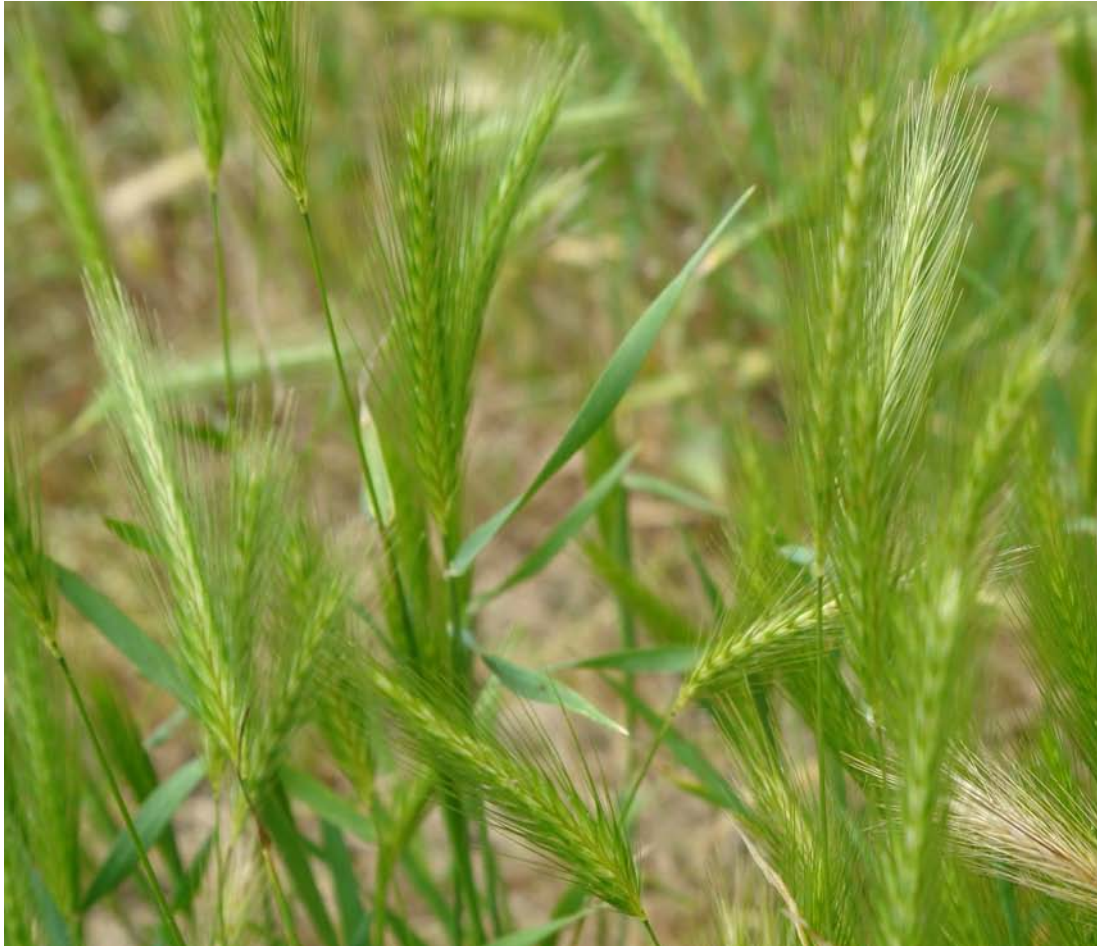
G: CEBADILLA C.: cebadilla de ratón N.C. Hordeum murinum