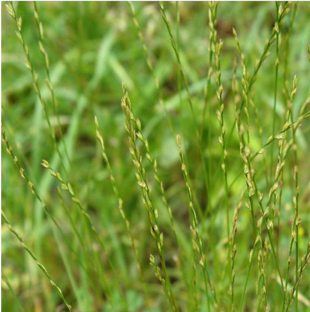
G.: XOIO C.: reigrás, cominillo, raigrás inglés N.C.: Lolium perenne