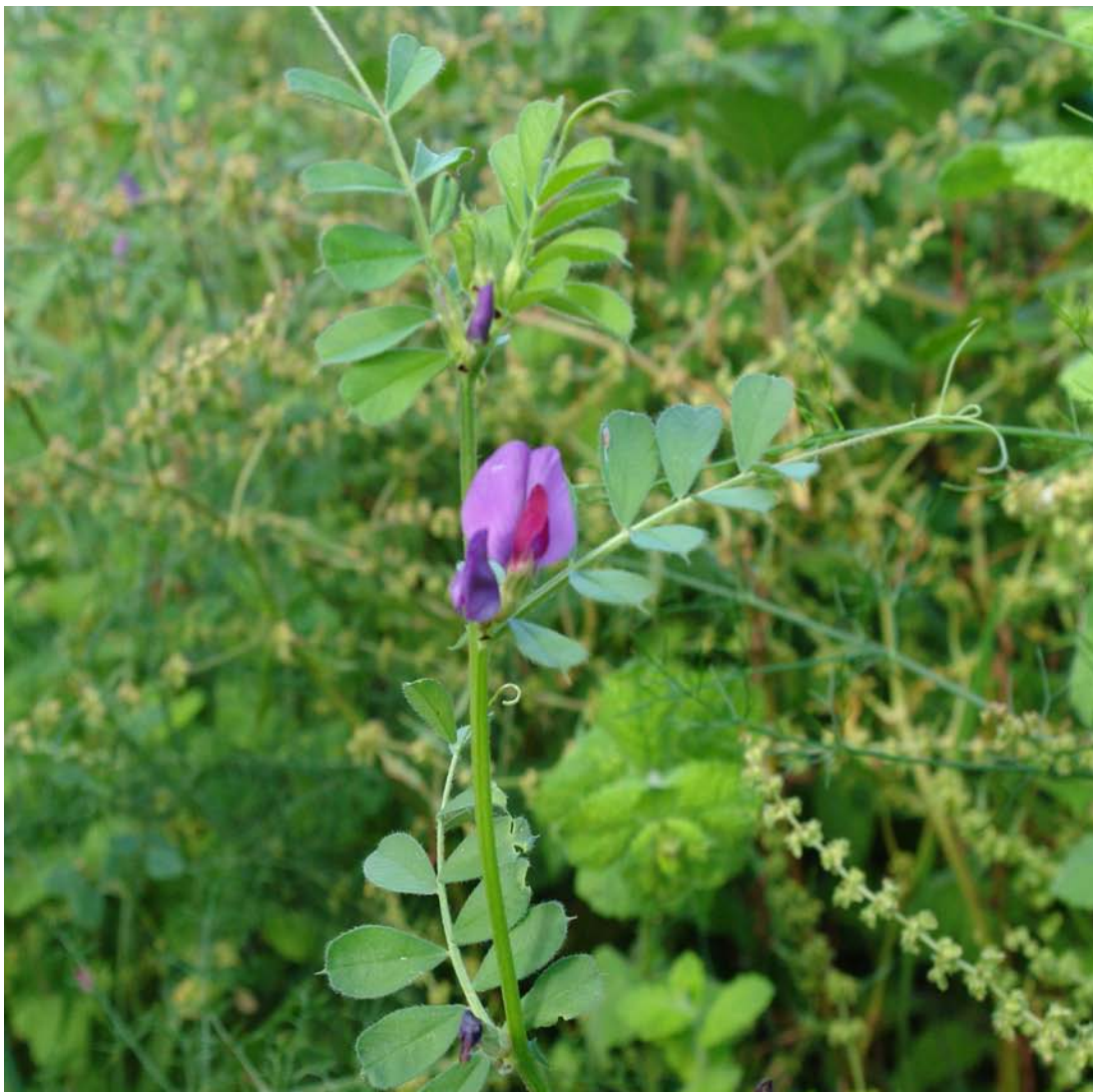
G: ERVELLACA, HERBA DA FAME C: arveja, algaroba común N.C.: Vicia sativa