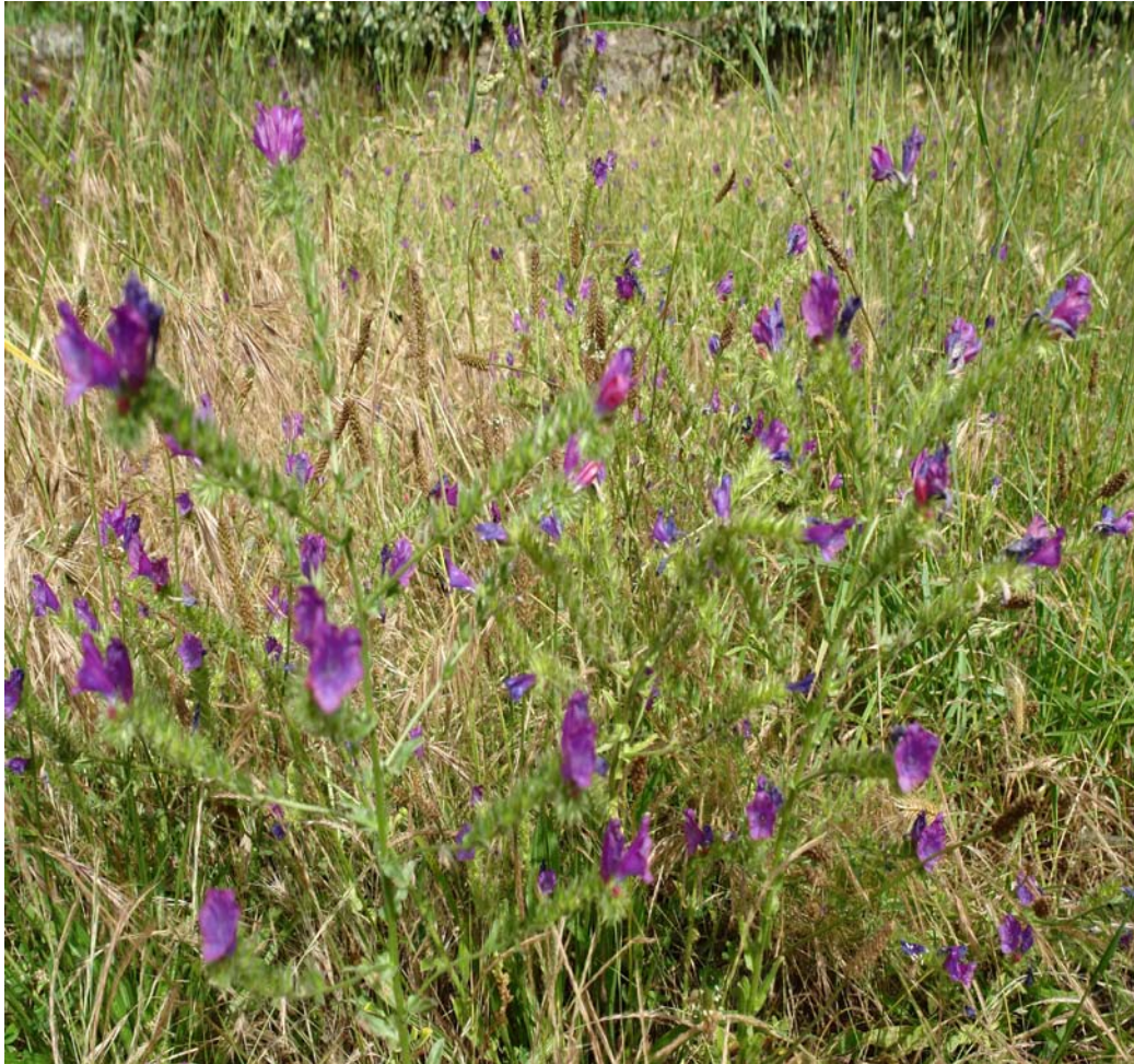
G: BORRAXA BRAVA, BORRAXÓN C: viborera N.C.: Echimium vulgare