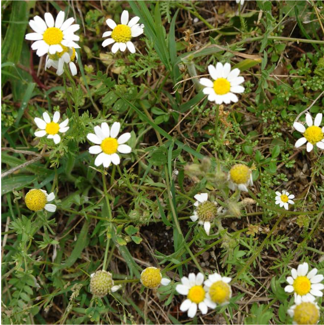
G: GAMARZA C.: manzanilla bastarda N.C.: Anthemis arvensis