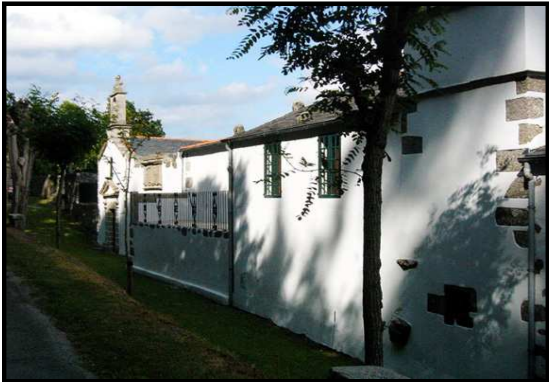
PAZO DE GRADAILLE (SANTA CRUZ – O VALADOURO)

O material empregado é a tella curva avermellada ou a lousa negra , dependendo da zona.