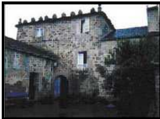
PAZO DE ADELÁN (ALFOZ)

A súa localización era no campo, lonxe dos camiños, nas ladeiras dos vales, nas cuncas dos ríos, en zonas con un microclima benigno e un solo moi fértil. Erguíanse nun lugar moi estratéxico do terreo, nun lugar alto para que ao tempo que o señor contemplaba as súas posesións, a súa casa fora vista dende calquer punto.