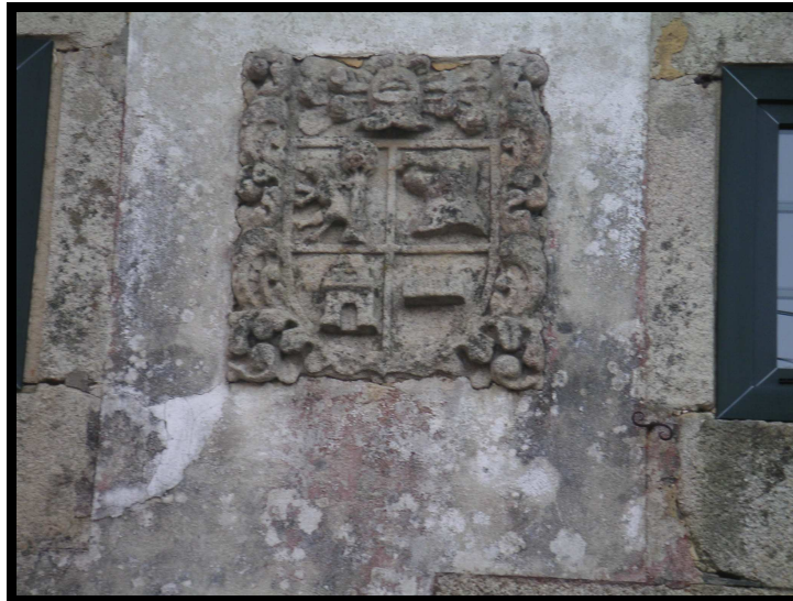
BRASÓN OU ESCUDO

Na sala de Fidalgos da “Real Chancillería de Valladolid” só figura un expediente de Morcín de Foz ¿Será esta esa casa, coñecida por Morcín ou Morsín en Vilachá de Cangas?