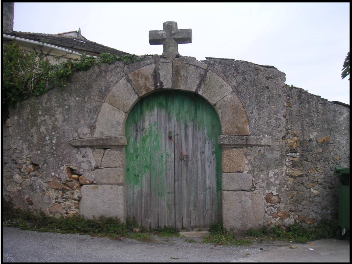
PORTA DE ENTRADA Á CAPELA

A capela estaba arrimada ao edificio principal. Está destruída e hoxe só queda en pé unha parede e a porta de entrada do exterior , a cal ten unha gran cruz de granito . Esta porta ten xambas e un perfecto arco de medio punto feitos en pedra de cantería ou granito. Nela venerábase á virxe das Marabillas.