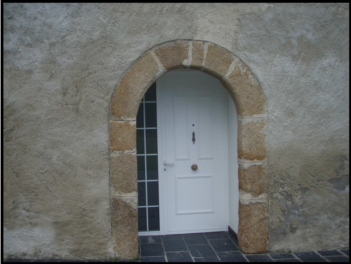
ARCO DE MEDIO PUNTO DUNHA PORTA DE ENTRADA

As fiestras e as portas son rectangulares e están rodeadas de molduras. Dúas portas están enmarcadas con xambas e arcos de medio punto feitos con pedra de granito .