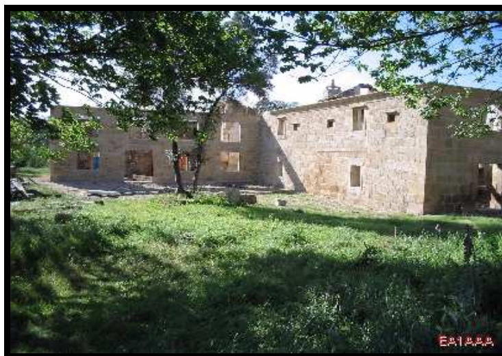
PAZO DE ALLEGUE (CARBALLIDO - ALFOZ)