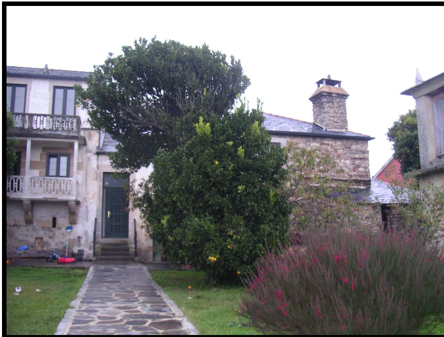
CASA DOS CRIADOS (Á DEREITA)

Ao lado da residencia señorial había outra dependencia que era a casa dos criados .