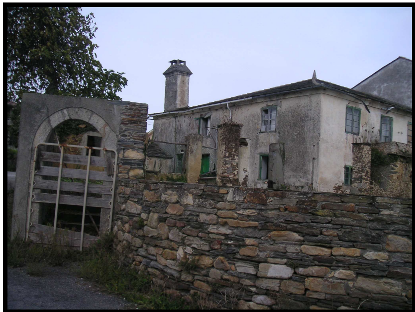
ENTRADA CON ARCO DE MEDIO PUNTO

O portal é de pedra de granito e como elemento decorativo leva unhas pedras encima do teito. Cabe destacar como curiosidade que a cuberta do mesmo prolóngase e aproveitase para cubrir unha pequena dependencia interior .