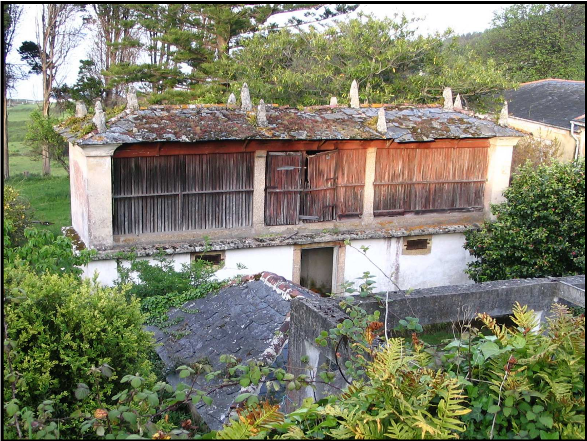
TRES VISTAS DO HÓRREO