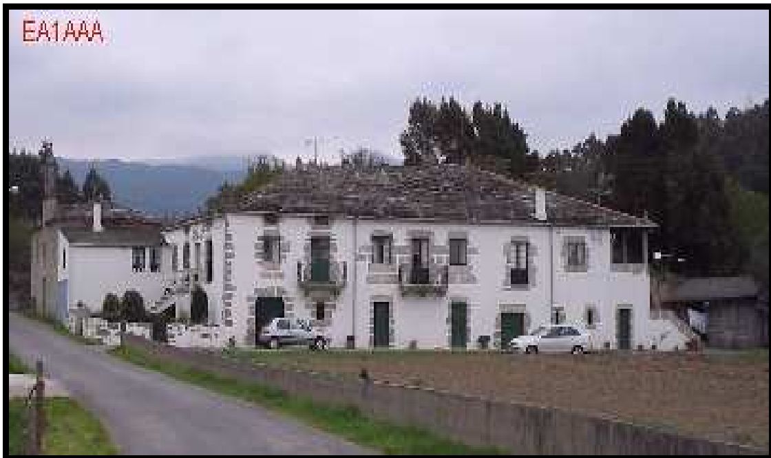
PAZO DE RIZAL (LAGOA – ALFOZ)

A escaleira e o patín non sempre están presentes nos pazos e danlle á fachada principal un aspecto aberto.