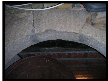
PORTAS QUE ÍAN ÁS CORTES E ÁS ESCALEIRAS DE DENTRO