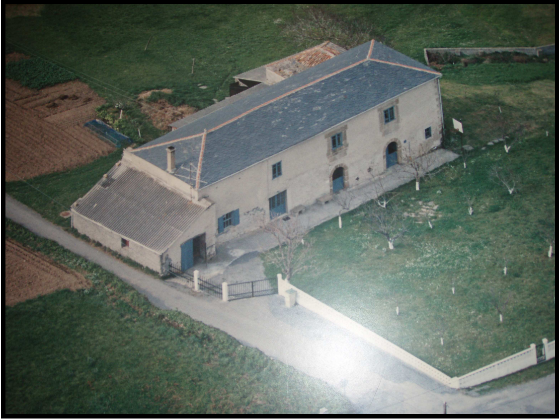
VISTA AÉREA DO PAZO