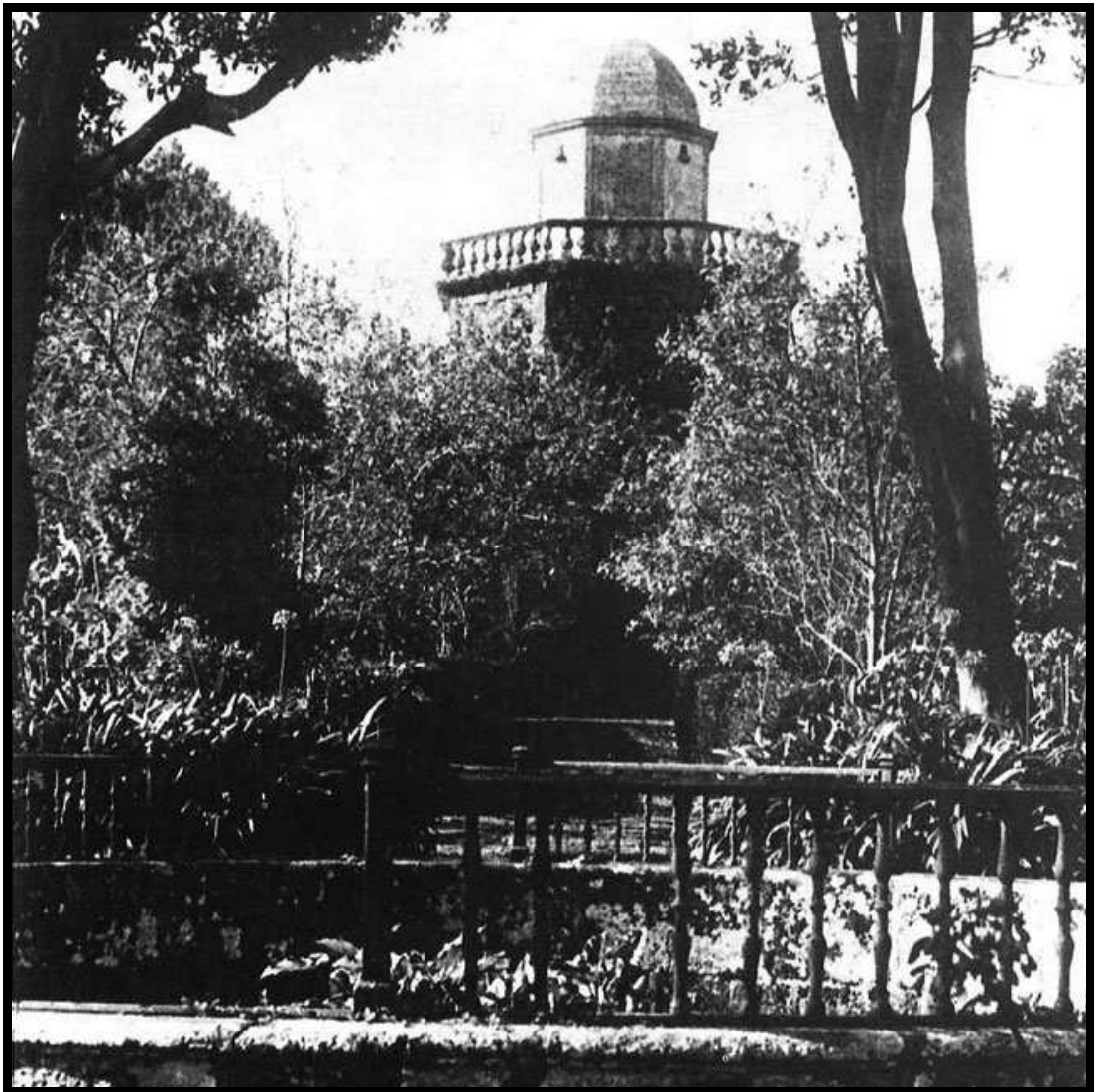
POMBAL DO PAZO DE SARGADELOS (CERVO)

Soe estar construído con cachotería, con varias entradas para as pombas, unha cornixa para que éstas alcen o voo e unha porta de acceso para as persoas. No seu interior dispóñense os niños, formando parte dos muros de pedra.