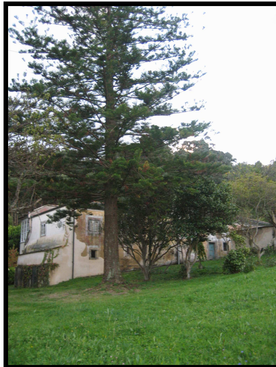
VEXETACIÓN E FACHADA POSTERIOR