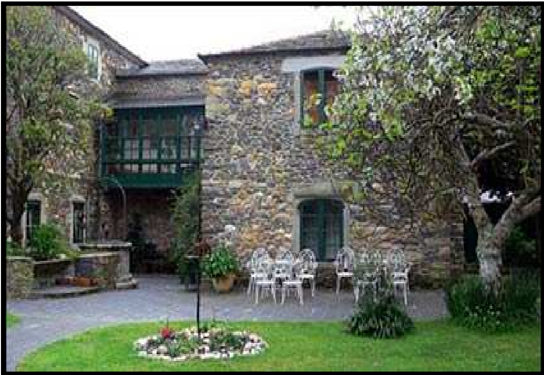
PAZO DA TRABE (VIVEIRO)

A torre é un elemento que ten a súa orixe na arquitectura militar. Pode ser un resto dunha antiga fortaleza medieval que se transformou en pazo, ou de construción coetánea. De todas maneiras é un símbolo de poder para lembrar que se trata dunha mansión cunha orixe de carácter feudal, dunha casa forte, e que os seus propietarios teñen un gran dominio da zona.