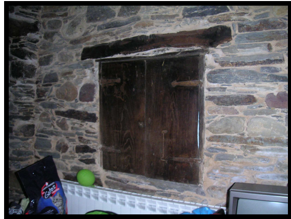
VENTÁ QUE DABA ÁS CORTES