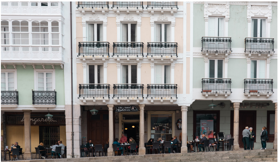
Cantón Grande de Mondoñedo

Se tivéssemos que lle asignar un estilo á cociña galega, habería que pensar na fermosura do románico rural, tan intimamente ligado ao ser e ao sentir do