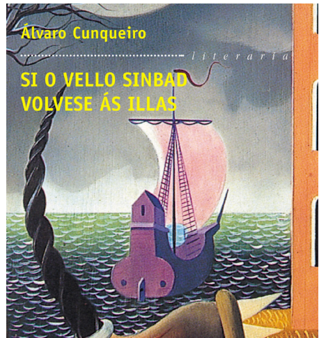
Si o vello Simbad volveuse ás illas

Considerado un dos máis destacados escritores galegos, unha escultura de Cunqueiro mirando á catedral de Mondoñedo recibe ao visitante na contorna da magnífica praza que se abre ante a portada oeste do dito templo. Poeta, dramaturgo, novelista e investigador gastronómico, é autor de títulos tan recoñecidos como As crónicas do sochantre , Se o vello Simbad volveuse ás illas , Xente de aquí e de acolá ou Merlín e familia e outras historias e está considerado como un mestre dentro da narrativa fantástica. Se queredes aprender sobre gastronomía galega, no vos podedes perder o seu libro A cociña galega . «No mundo da cociña poderíase falar de estilos. Así, por exemplo, existe o barroquismo oriental da cociña chinesa e do rococó da francesa [...]