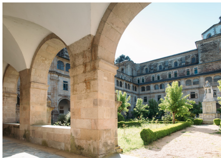
Claustro do Padre Feijoo

Monterroso é un importante enclave para a tradición xacobeá, xa que na súa