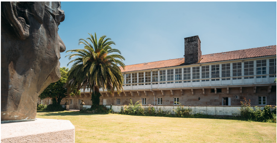
Fundación Camilo José Cela

O seu legado cultural consérvase e difúndese desde a Fundación Camilo José Cela , que vos invitamos a visitar na mesma Iria Flavia. Nela poderedes achegarvos ao museo, á biblioteca, á