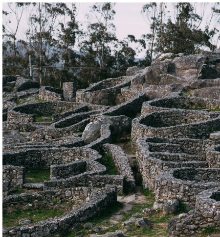
Monte de Santa Trega

Vigo celebra anualmente a súa feira do libro a finais de xuño e principios de xullo na praza de Compostela. É un bo plan de ocio se vos coincide visitar a cidade nestas datas. Así mesmo, visitantes e veciños poden descargar o Mapa Literario de Vigo, elaborado pola Biblioteca Xosé Neira Vilas e o Concello de Vigo, no que se sinalan lugares da cidade que serven de localización en diversas publicacións. Deixámosvos o enlace para que podíades acceder a el.