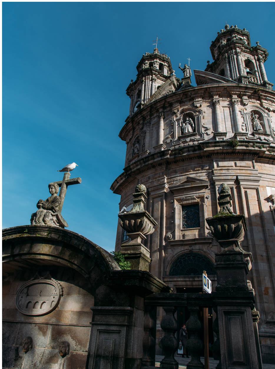
Santuário da Virxe Peregrina, Pontevedra