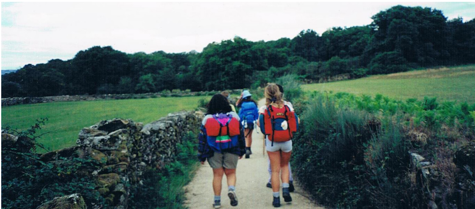
O primeiro camiño de Alba

Que gardo na miña memoria? Pois moitas imaxes, emocións e momentos: desde as paisaxes galegas á primeira hora da mañá, bañadas de resío, entre carballeiras de conto, ata os encontros con diversa xente que animaban a noso percorrido.