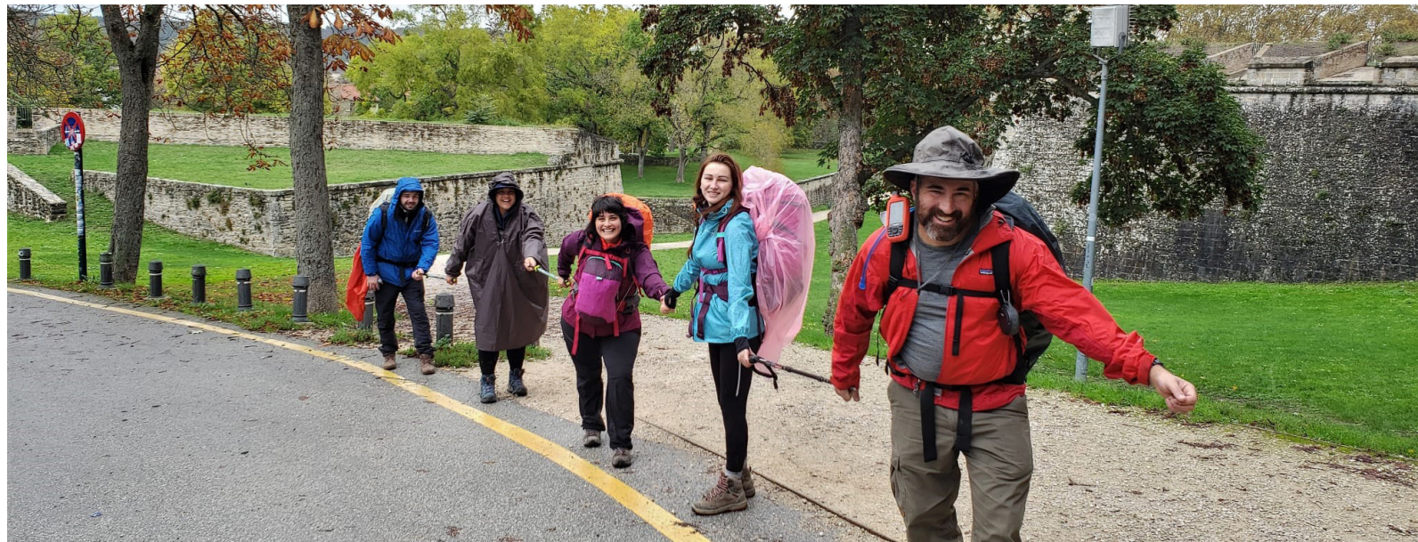
Entrando en Pamplona

Entón, eu traballaba nunha escola como mestra integradora, pero non podía máis. Eu tomábame o acompañamento moi en serio, estaba moi involucrada, pero loitar contra o inmovilismo institucional facíase moi difícil. Non podía deixar o traballo porque quedaba sen ingresos, pero dábame conta de que me estaba facendo dano. Entrei en crise e decidín tomar unha excedencia duns meses. Cortei o pelo, empecei a facer outras cousas e, cando volví en agosto, resultou que non tiñan un posto para ofrecermos, así que, de súpeto, atopeime sen relación de dependencia, con tempo libre e cunha boa indemnización.