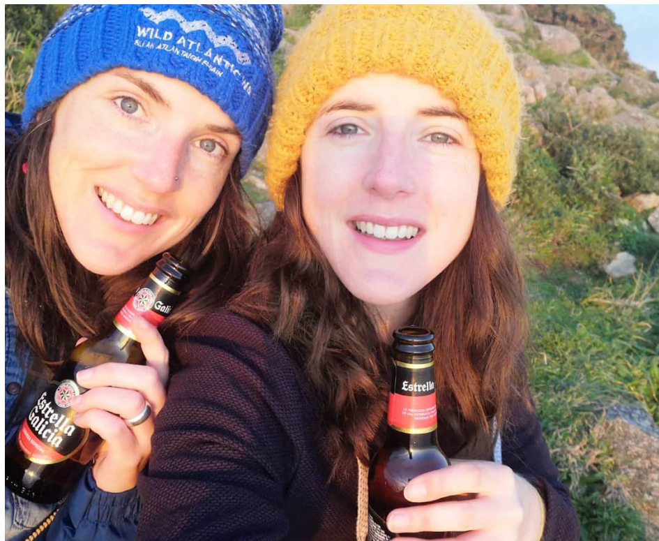
En Fisterra, remate do camiño

Agora boto de menos viaxar, pero aproveito para descubrir o que teño máis preto. Confío en que no futuro, cando pase todo este asunto do virus, poidamos volver de novo a camiñar.