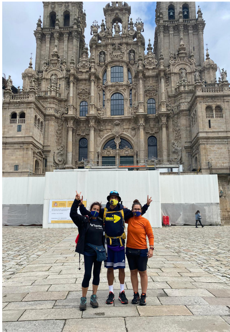
Na Praza do Obradoiro en Santiago de Compostela

Non tiven ningunha mala experiencia no Camiño, nin sequera torceduras ou bochas. Xa ves, con 58 anos e cunha pandemia polo medio, e acabo de chegar de Santiago!