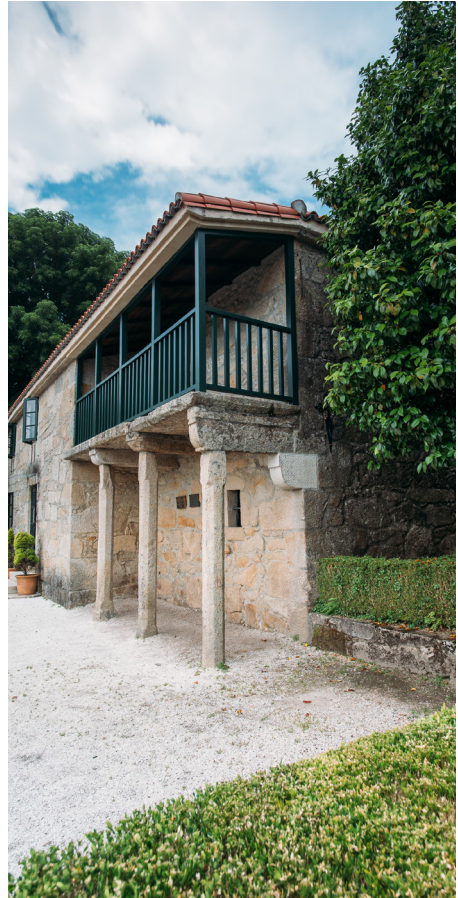
Casa Museo de Rosalía de Castro en Padrón

Francisco e Julio Camba son os outros grandes escritores de Vilanova. Ambos moi vinculados no eido xornalístico, desenvolveron a súa carreira en diversos periódicos e diarios a nivel nacional, que compaxinaron coas súas traxectorias literarias como novelistas. Instaláronse os dous en Madrid, aínda que Julio sería corresponsal de diversos medios en distintos enclaves internacionais. Deste recompiláronse artigos para títulos como Crónicas de viaje . Impresiones de un corresponsal español ,