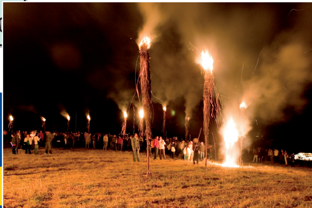
Fochas de Castelo (Taboada)