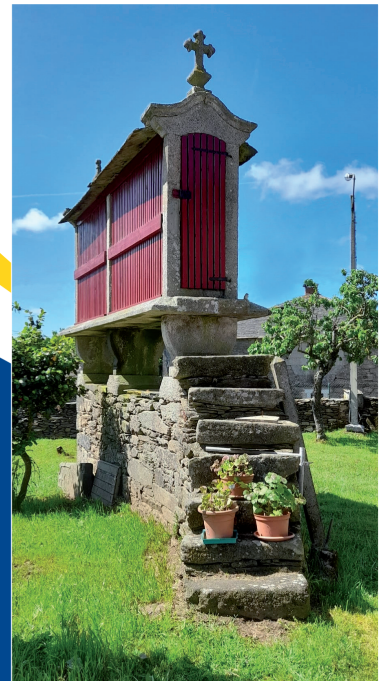
Hórreo en Ouroil