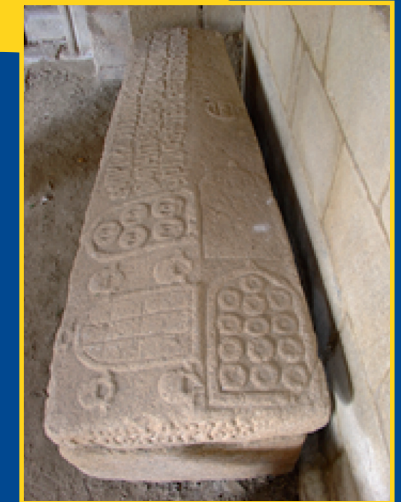
Sepulchro de Ares Pérez de Taboada