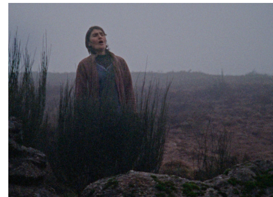
Quando a Terra Foge

Quando a Terra Foge é um registo poético de uma região em perigo pela iminente exploração de lítio na região de Montalegre. Enquanto as máquinas escavam as imponentes montanhas, um