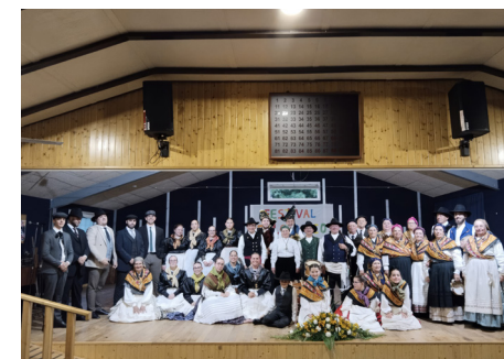
Os Muíños de Oliveira

Cantareiras e o de Pandereteiras e o Grupo de Danza Moderna “Metamorfose”, atuando com um repertório de músicas populares e tradicionais que já foi interpretado desde a Costa da Morte até a Serra dos Ancares, passando por diversos pontos da geografia galega.