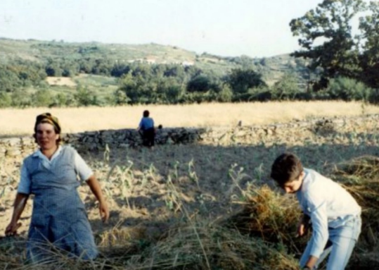
Terra de Abril