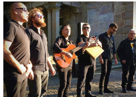
Voces de Arrieiro

O Grupo Voces de Arrieiro foi fundado em 2012, com a intenção de “contar contos musicais” a partir da figura dos antigos