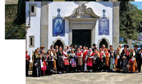
Canto D’Aqui e Rusga de S. Vicente