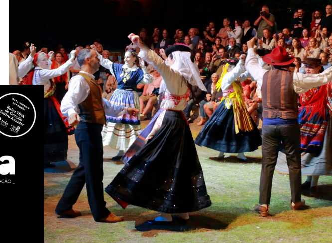
Rusga de S. Vicente

A Rusga de São Vicente — Grupo Etnográfico do Baixo Minho — atuará junto com o grupo de Pontearreas Os Muíños de Oliveira, formado em colaboração pelo Grupo de Baile Galego, a Escola de Gaitas e Percusión, o Grupo de