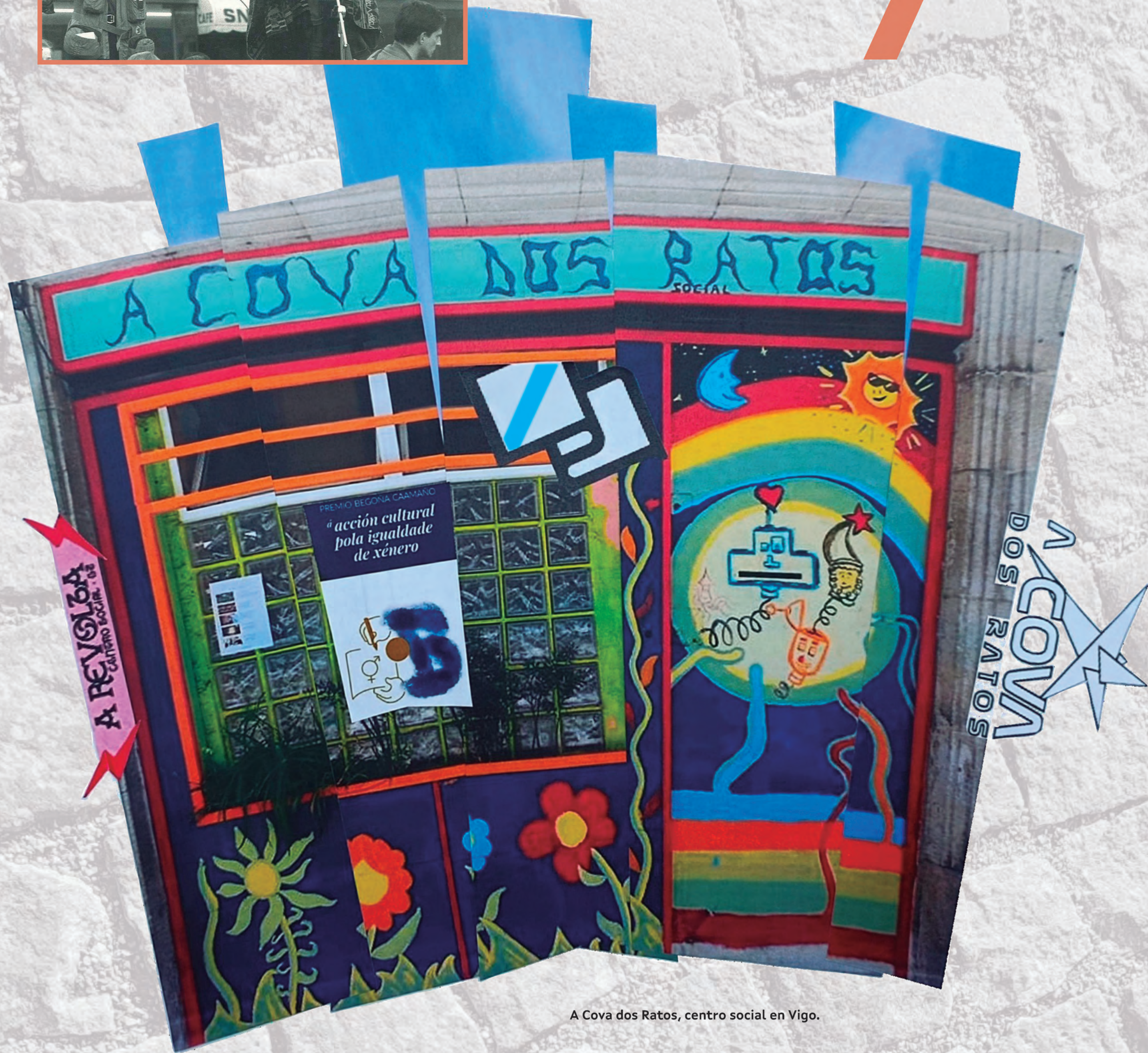
A Cova dos Ratos, centro social en Vigo.

Foi unha loitadora en primeira liña polos dereitos do mundo laboral, polos dereitos da muller e do feminismo, e reivindicou a defensa do noso medio ambiente diante de ataques como o que sufriu no afundimento do Prestige, alén de amosar o seu compromiso con outras causas como a do antimilitarismo. Desenvolveu, tamén, postos de responsabilidade no ámbito sindical do nacionalismo.