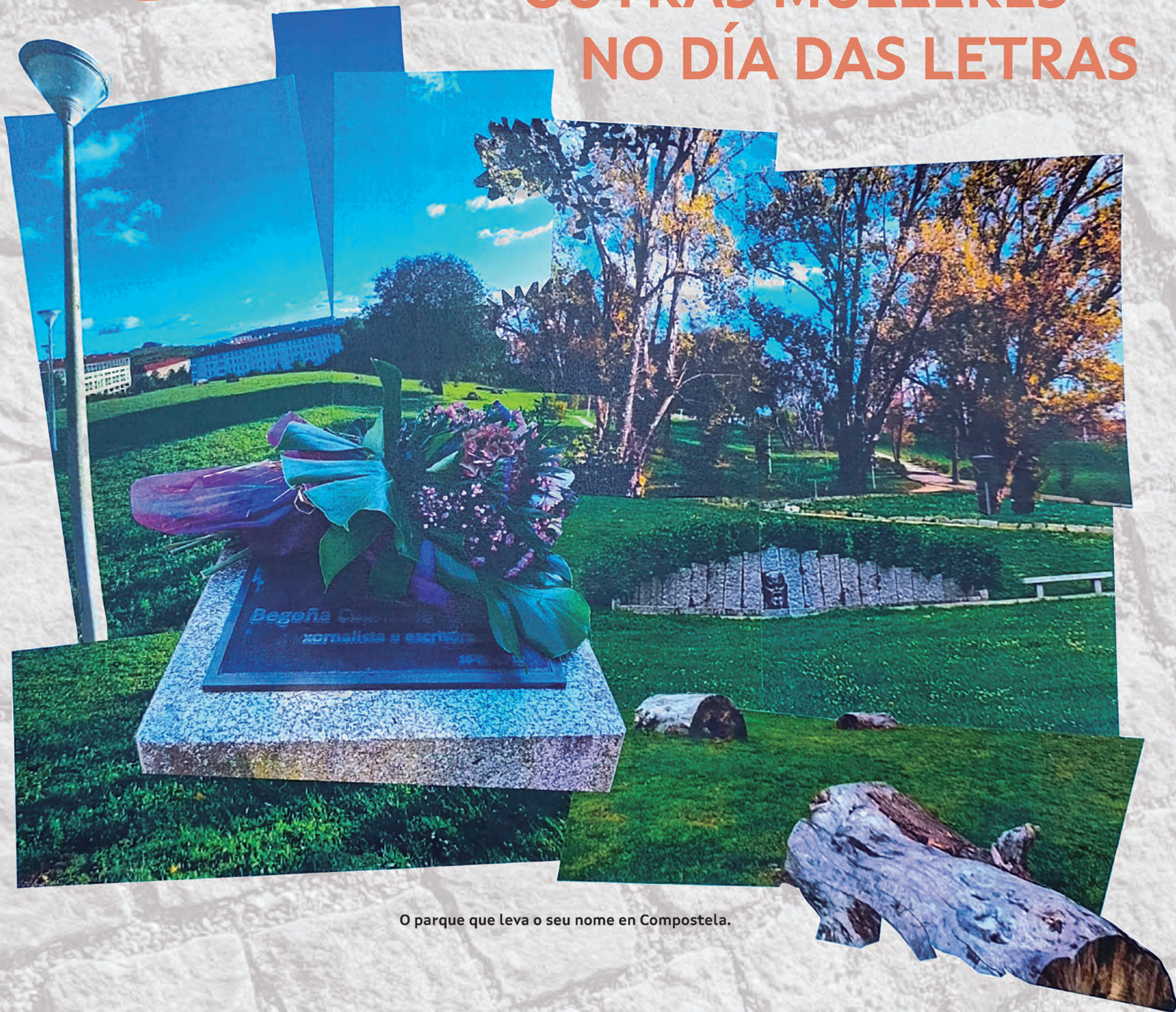
O parque que leva o seu nome en Compostela.

Begoña Caamaño destacou pola súa obra narrativa feminista, con títulos como Circe ou o pracer do azul (2009) e Morgana en Esmelle (2012). Esta última recibiu o Premio da Crítica de narrativa galega, o Premio Ánxel Casal, o Premio Antón Losada Diéguez e o Premio da AELG á mellor obra de narrativa, o que a converteu nunha das autoras máis recoñecidas da literatura galega contemporánea.