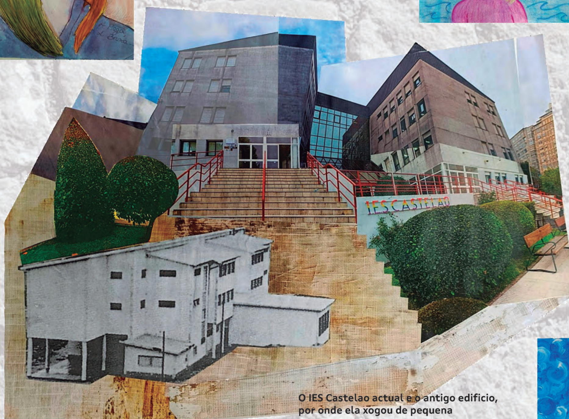
O IES Castelao actual no antigo edificio, por onde ela xogou de pequena