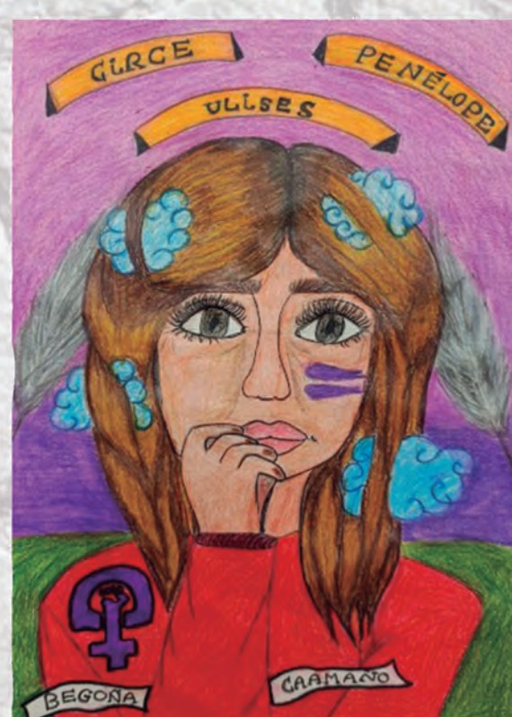
Interpretacións artísticas do alumnado do IES Castelao sobre a figura e a obra de Begoña Caamaño