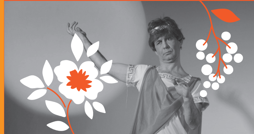
▼ Badius, Teatro.

Nesta véspera das Letras estreamos “A peregrinaxe”.