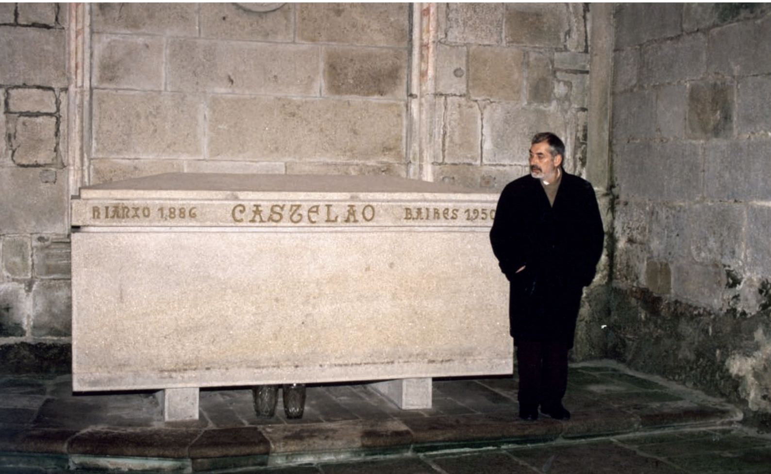
Diante da tumba de Castelao, 2000