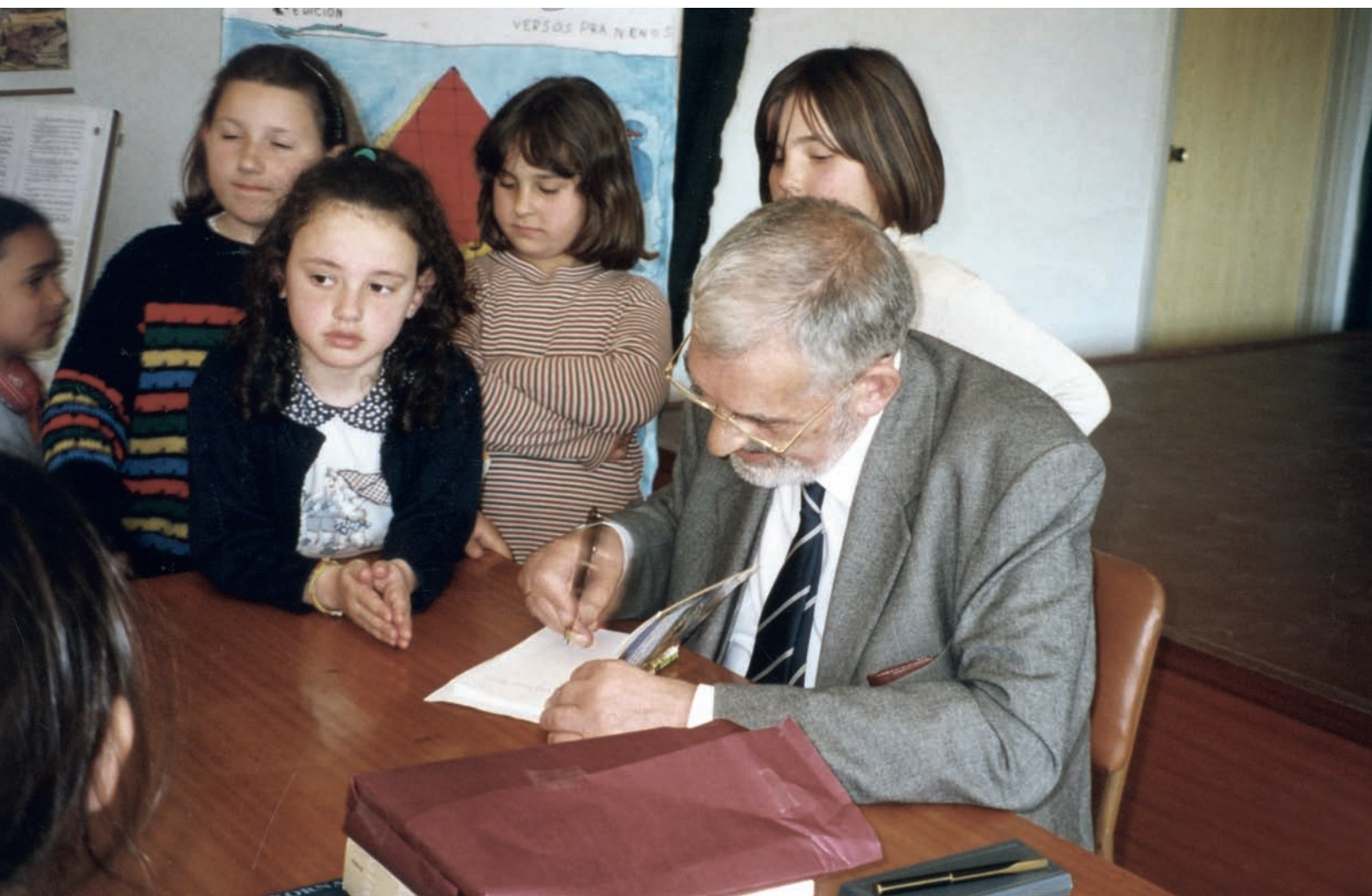
Cos nenos no colexio de Alxén, en Salvaterra de Miño