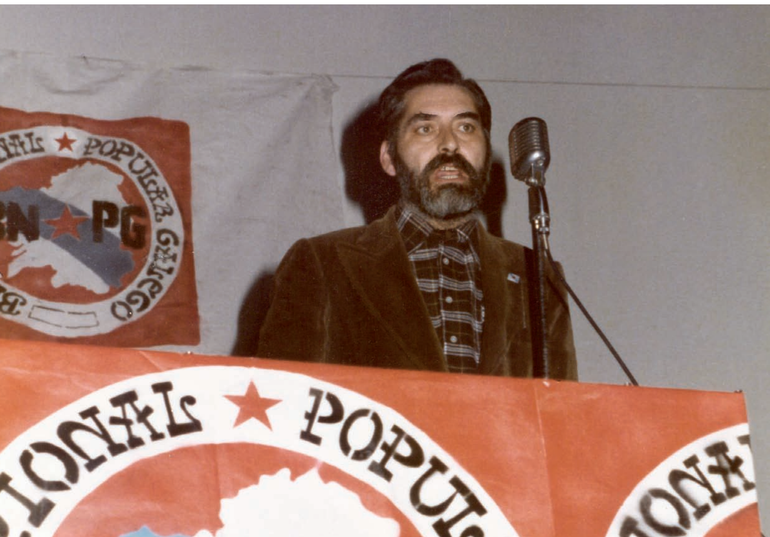
Nun mitin do BN-PG