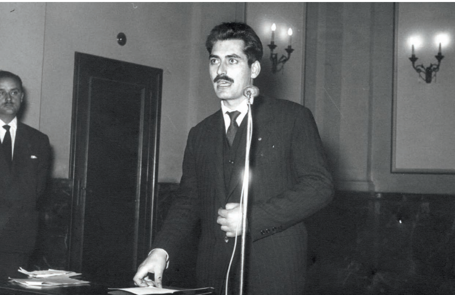
Manuel María nunha conferencia