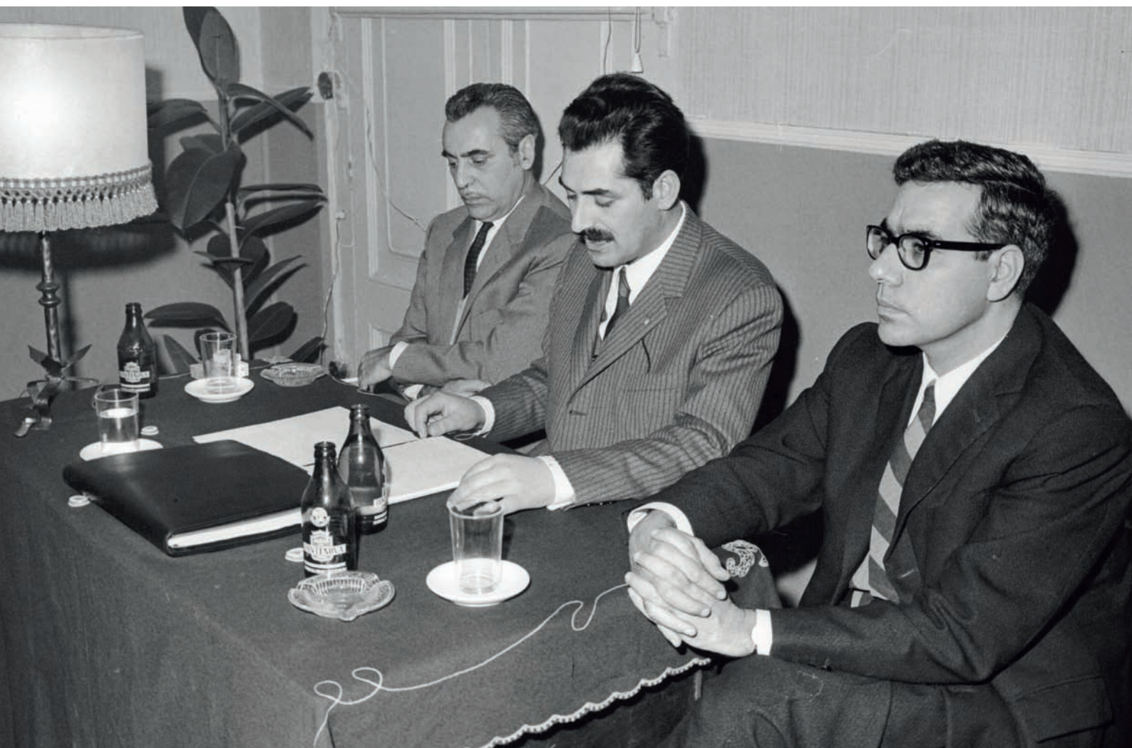
Conferencia no Centro Galego de Barcelona