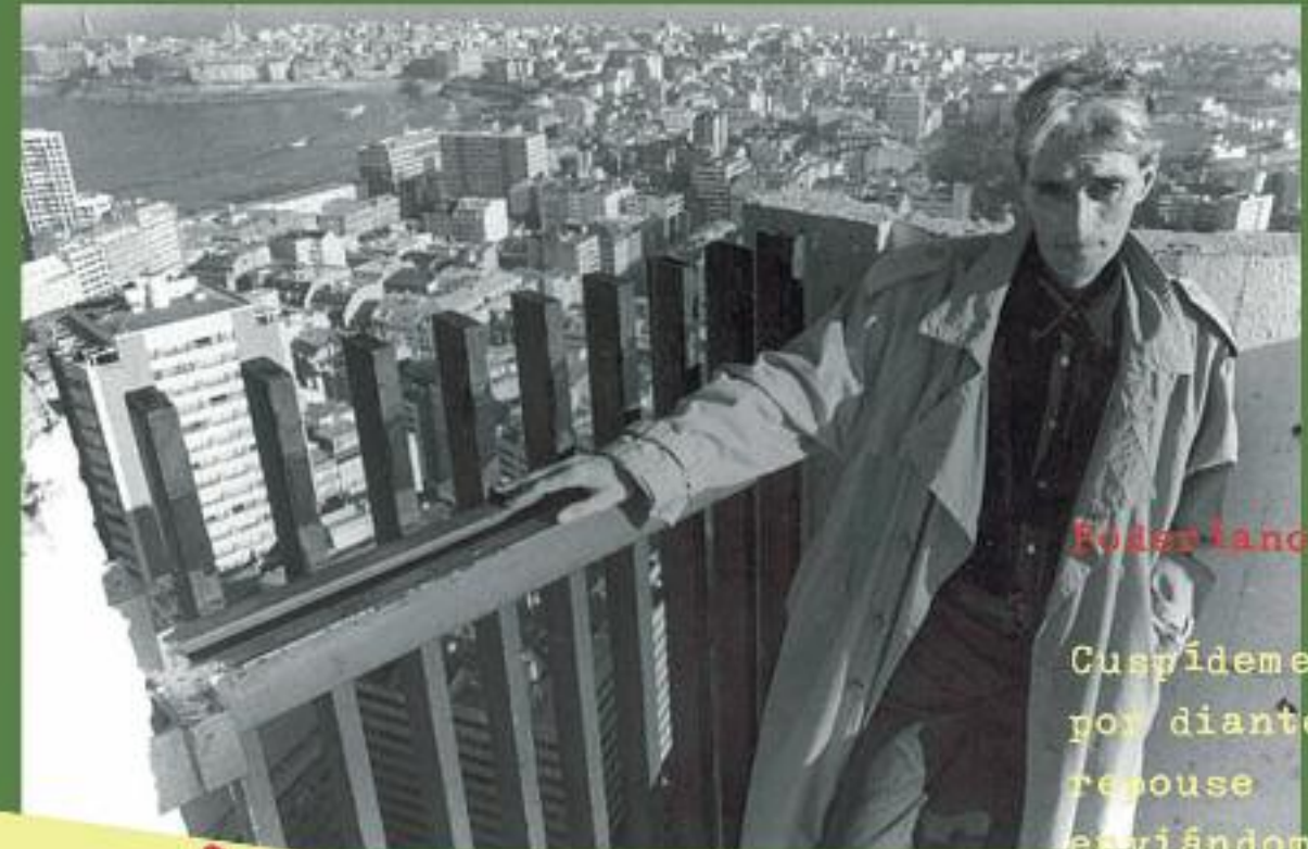
Reparando o asfalto como epifanía

Cuspídemme enriba cando pasedes por diante do lugar no que eu repouse enviándome unha húmida mensaxe de vida e de furia necesaria. outono, 95