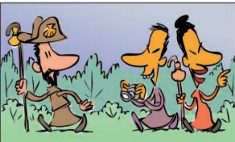
4. Como na actualidade, na idade media Santiago de Compostela xa era un centro de peregrinación, debido ao descubrimento do sepulcro do Apóstolo Santiago, no ano 813.