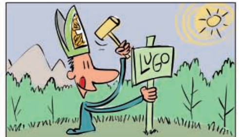
6. Cara ao século XVI, a división administrativa de Galicia era diferente á actual. Tiña sete provincias que se correspondían coas sedes episcopais: Santiago, Betanzos, Lugo, Mondoñedo, Ourense, Tui e A Coruña.