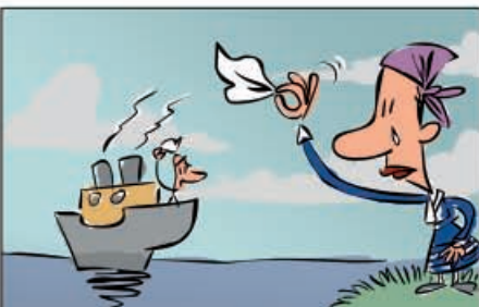
7. A finais do século XIX e durante a primeira metade do XX, moitos galegos emigraban a América. Bos Aires era chamada "a quinta provincia galega", xa que nela había máis galegos que nas propias cidades de Galicia.