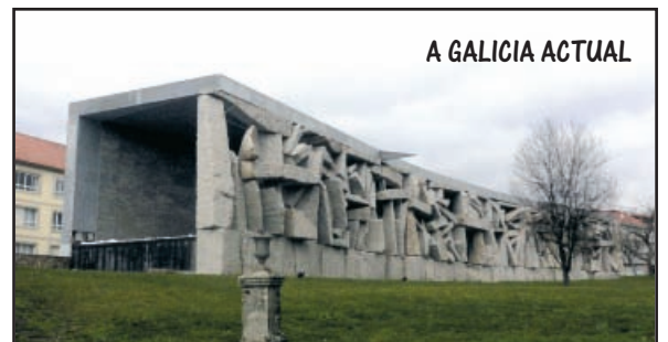
A GALICIA ACTUAL