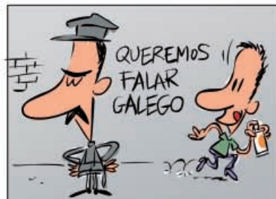
8. Durante a ditadura de Franco (1939-1975), en Galicia non había liberdade de expresión, prensa, reunión etc., e o galego non se podía empregar nin na Administración nin na educación.