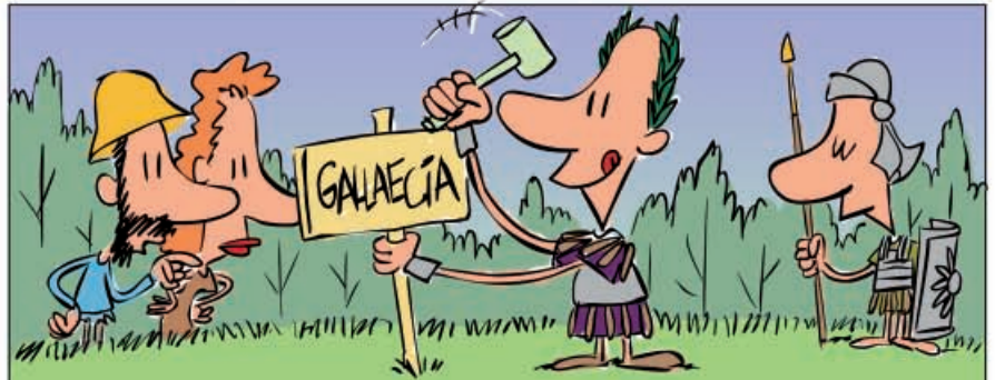
3. No século I d. C., Gallaecia era unha provincia do Imperio Romano. Non tiña as fronteiras que ten hoxe en día, xa que se estendía ata o oeste do río Pisuerga e o norte do río Douro. As principais cidades eran as fundadas polo emperador Augusto: Lucus Augusti (Lugo), Bracara Augusta (Braga) e Asturica Augusta (Astorga).