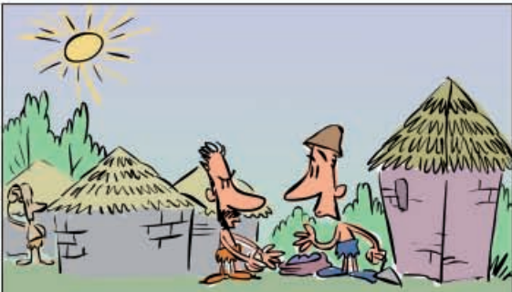
2. No século V a. C., o noroeste da Península estaba poboado por unha maioría de etnia celta. Vivían en poboados que se chamaban castros e que estaban constituídos por construcións de estrutura circular.