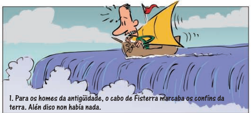
1. Para os homes da antigüidade, o cabo de Fisterra marcaba os confíns da terra. Alén diso non había nada.

Aquí tes oito viñetas que mostran algunhas cousas que pasaban en Galicia en varios momentos da historia. E hoxe en día? Que podes dicir da Galicia actual? Escribe o texto do último cadro.