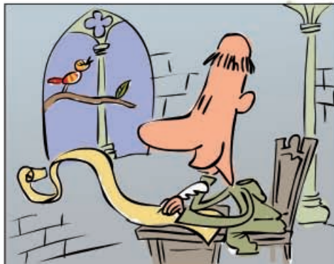
5. Entre os séculos XII e XIV, a lírica galego-portuguesa era a máis importante da península Ibérica.