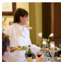
dona do restaurante