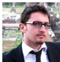
representante de viños