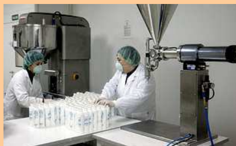
O laboratorio que creou a crema con auga do Xurés e arxila aurífera fabrica para hoteis e balnearios

O Inorde, organismo do que depende o Padroado de Turismo de Ourense, ten previsto adxudicar, en pouco tempo, a comercialización. Superado este trámite, a beleza que nace do subsolo comercializarase en tendas especializadas, balnearios ou farmacias para, a través do coidado persoal, atraer novos turistas e fidelizar os que xa coñecen a provincia.