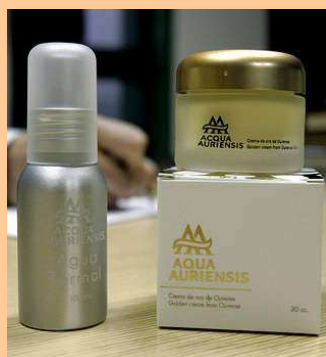
A liña Aqua Auriensis inclúe unha crema e un vaporizador

Ourense é auga e ouro. A primeira circula, enriquecida, baixo a terra. O segundo forma parte da provincia etimolóxica e historicamente. Por iso, e por tratarse de dous produtos con propiedades beneficiosas para a pel, escolléronse para desenvolver a crema facial e o difusor termal made in Ourense. O laboratorio encargado de crear os cosméticos fabrica ata catro mil referencias (desde produtos capilares a xeles de baño pasando por cremas faciais e corporais) para setenta clientes diferentes, entre os que se atopan grupos hostaleiros, perfumerías ou balnearios de Galicia, pero tamén do resto de España e ata de México e dos Estados Unidos. Producen todo tipo de cosméticos aínda que, por unha cuestión de filosofía, intentan centrarse nos produtos máis próximos aos naturais, mesmo ecolóxicos. Iso inclúe traballar con algas -algo xa estendido no sector- pero tamén cun produto de efecto antioxidante como o toxo. E é só un exemplo.